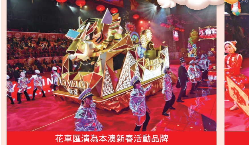
花車匯演為本澳新春活動品牌

中區北區先後巡遊 花車匯演開幕典禮於年初三晚八時舉行，特邀香港樂隊組合SuperMoment和內地歌手組合AKB48TeamSH，以及關詠、吳若希和澳門歌手歐陽日華等輪番獻唱，十八輛閃爍奪目的花車聯同超過一千名內地及港澳地區表演者在西灣湖廣場起步，經孫逸仙大馬路到達終點澳門科學館，觀眾席設於西灣湖廣場、孫逸仙大馬路、觀音蓮花苑前廣場和澳門科學館前圓形地，觀眾可於當天下午五時半起入場，入場人士需佩戴口罩。場地設少量無障礙觀賞位置，供有需要人士使用。其中，西灣湖廣場起步舞台將於下午五時半