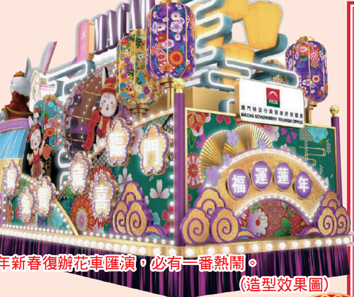
今年新春復辦花車匯演，必有一番熱鬧。

開始暖場表演，率先帶動現場熱鬧氣氛。 年初七晚八時，十八輛花車將到北區熱鬧巡遊，先在沙梨頭北街起步，途經青洲大馬路、拱形馬路、黑沙環馬路、慕拉士大馬路、黑沙環第四街、長壽大馬路、市場街至祐漢街市公園。當晚八時十五分起在祐漢街市公園亦安排壓軸文藝表演，港澳嘉賓胡鴻鈞和MFM組合等傾力演出，齊慶新歲。 主辦單位分別在友誼廣場、澳門科學館、澳門科學館圓形地、祐漢街市公園、宋玉生公園、南灣湖水上活動中心、塔石廣場和氹仔消防局前地設立LED屏幕作現場直播。澳門廣播電視和澳門有線電視將在多條頻道直播及錄播花車匯演，方便觀眾在家欣賞。