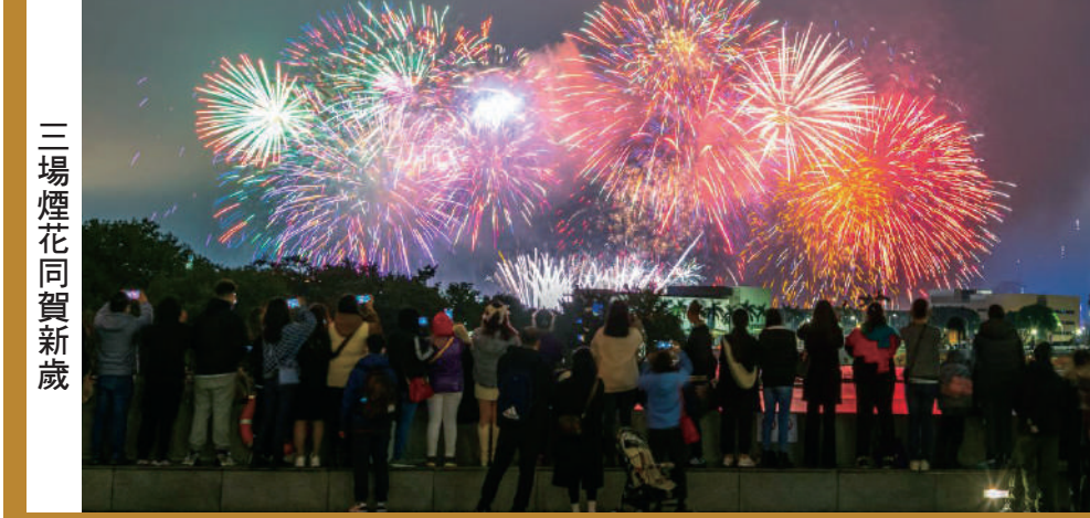
三場煙花同賀新歲

為營造更濃厚的春節氣氛，旅遊局將於年初一及年初二分別舉行“二〇二三年農曆新年慶祝活動——龍騰舞躍賀新春”，屆時安排財神、福祿壽三星、兔生肖、金童玉女、澳門旅遊吉祥物“麥麥”和龍獅隊等穿梭澳門各區，向居民及旅客拜年。 煙花表演倍添熱鬧 同時，特別安排三場煙花表演助興，分別於年初三（一月廿四日）及年初七“人日”（一月廿八日）晚九時四十五分在旅遊塔對出海面呈獻十五分鐘煙花表演，同賀新歲。元宵佳節（二月五日）晚九時將盛放第三場煙花表演，延續農曆新年的喜慶氣氛。