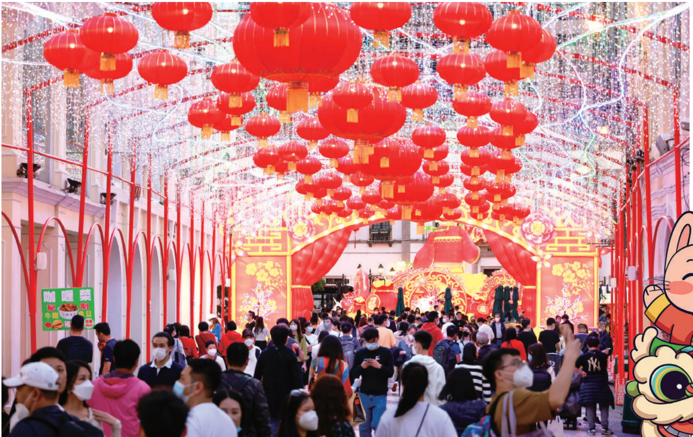
隨著防疫及通關措施逐漸放寬已吸引大批旅客來澳遊玩

益隆炮竹廠舊址遊徑亦於大年三十至年初三（1月21日至24日）及初七、初八（1月28日至29日）舉行一系列春節慶活動，包括寫揮春、炮竹業及炮竹廠歷史導賞、並設有以炮竹廠為主題的新春節品工作坊、舞獅、詠春拳及蔡李佛拳等非遺表演項目。