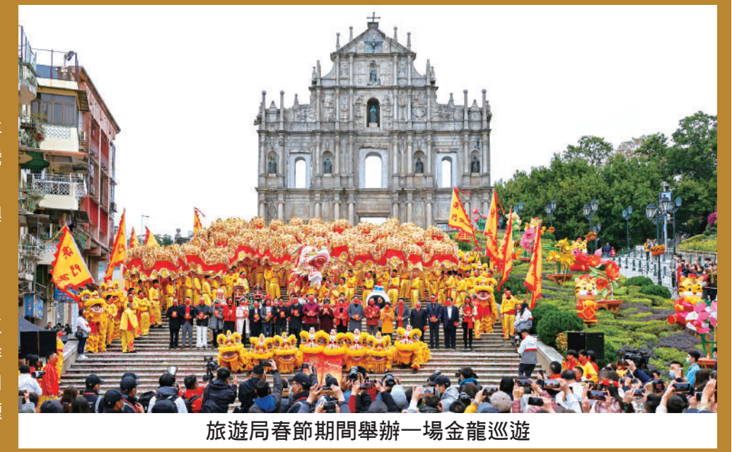
旅遊局春節期間舉辦一場金龍巡遊

為營造更濃厚的春節氣氛，旅遊局將於年初一及年初二分別舉行“二〇二三年農曆新年慶祝活動——龍騰舞躍賀新春”，屆時安排財神、福祿壽三星、兔生肖、金童玉女、澳門旅遊吉祥物“麥麥”和龍獅隊等穿梭澳門各區，向居民及旅客拜年。 煙花表演倍添熱鬧 同時，特別安排三場煙花表演助興，分別於年初三（一月廿四日）及年初七“人日”（一月廿八日）晚九時四十五分在旅遊塔對出海面呈獻十五分鐘煙花表演，同賀新歲。元宵佳節（二月五日）晚九時將盛放第三場煙花表演，延續農曆新年的喜慶氣氛。