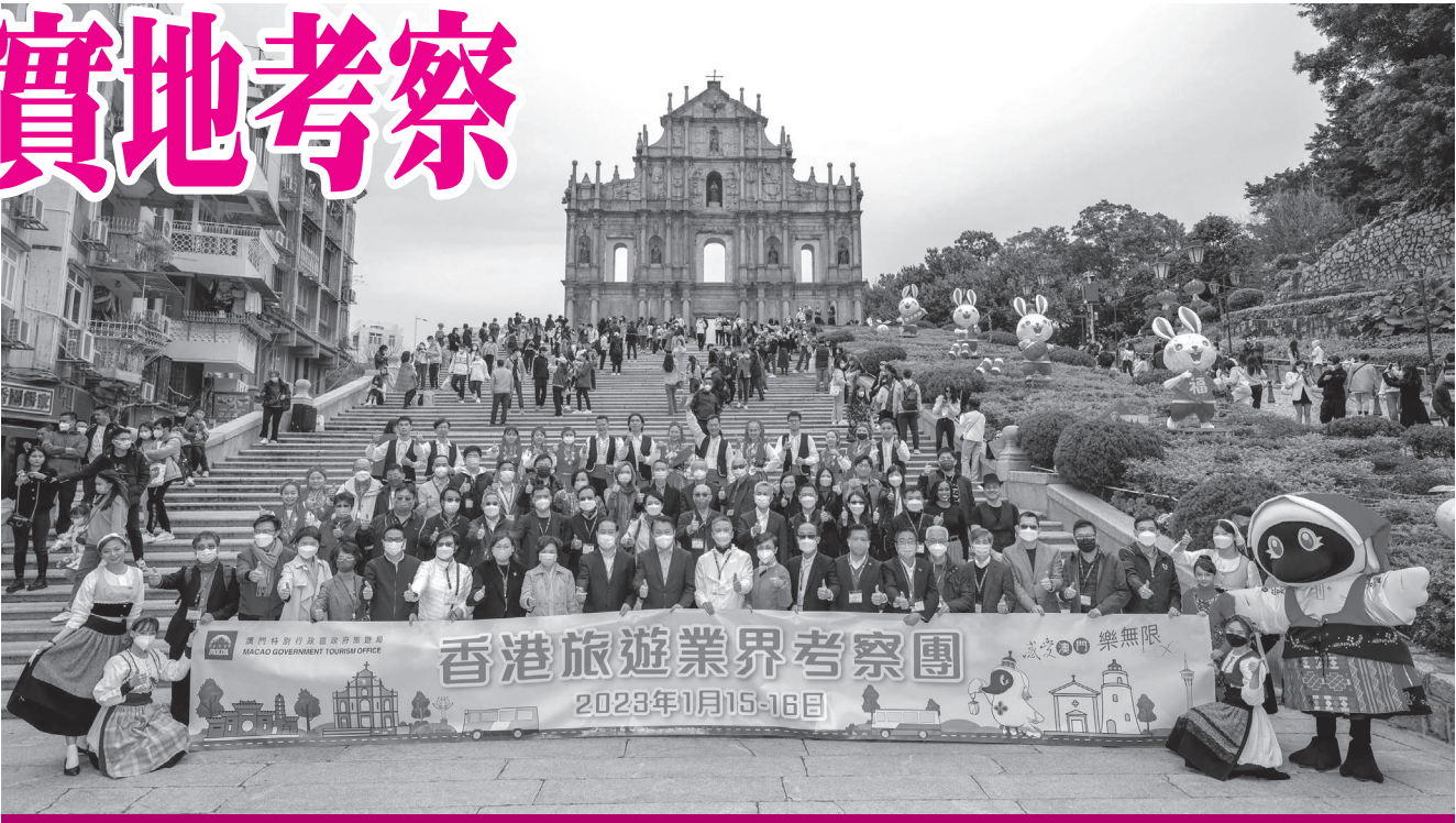
經濟財政司司長李偉農與香港旅遊業界考察團於大三巴合照