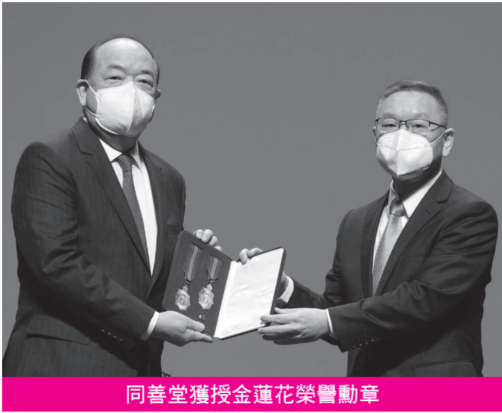
同善堂獲授金蓮花榮譽勳章