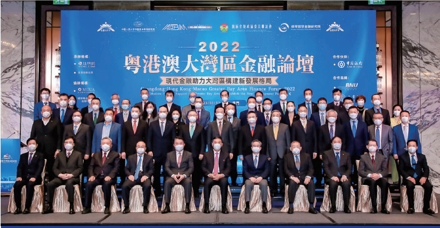
粵港澳大灣區金融論壇開幕式嘉賓合影