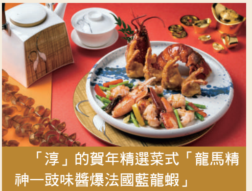
「淳」的賀年精選菜式「龍馬精神一鼓味醬爆法國藍龍蝦」

大堂酒廊以新春佳節禮品同賀新歲。「玉兔迎春新年禮盒」設計新穎，採用今年流行的桃紅色系，搭配葡式瓷磚花紋而成的兔子造型。禮盒有四種糕點，包括油角、粟蓉千層酥、琥珀核桃及笑口棗。此外，澳門君悅酒店準備了賀歲節目慶祝農曆新年。誠邀賓客於年三十除夕（1月21日）舉行燃放八百萬頭的炮竹齊響，寓意一聲除舊歲。年初三（1月24日）設有喜慶節目，與舞獅及財神一同迎接新春，悅度精彩兔年。