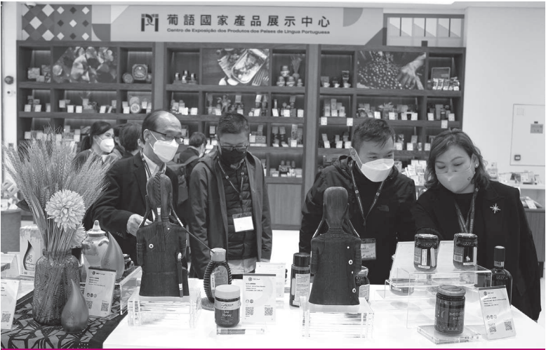
考察團參觀中國與葡語國家商貿合作服務平台展示館

來自香港的旅遊業考察團主要由業界領袖組成，成員包括香港旅遊業議會及屬會、香港立法會議員（旅遊界功能界別）、亞洲旅遊交流中心領導、主要旅遊團體及旅行社、港澳跨境交通營運商代表等。