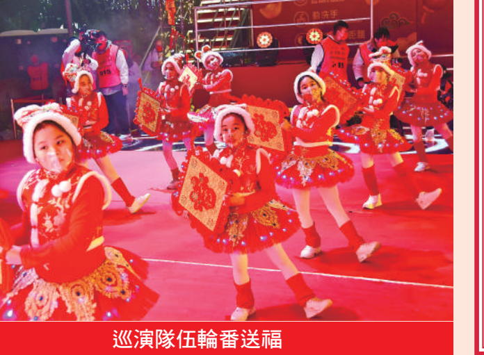
巡演隊伍輪番送福

於兩場地展出花車 參與匯演的花車將於一月廿五至廿七日在科學館海堤展出。一月廿九日至二月十二日則在塔石廣場展出，歡迎居民及旅客到場“打卡”。澳門居民及旅客可於一月二十日至二月十二日期間參與線上遊戲，在完成指定任務後獲得“福運連”，儲得指定數量的“福運連”，即獲線上抽獎機會。 匯演期間實施臨時交通措施，年初三及年初七下午五時至晚上十一時，巡遊路線途徑道路將臨時封閉，部分巴士站點將臨時停用，路線將改道行駛，敬請留意交通部門最新資訊。花車匯演詳情可瀏覽 https://www.macaotourism.gov.mo/zh-hant/article/cny/parade-2023 ，或關注“澳門特區旅遊局”微信了解更多內容。