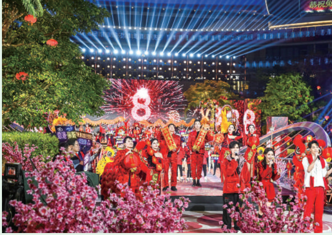
節目薈萃了粵港澳三地的知名藝人和表演團體參與錄製

【本報訊】由廣東廣播電視台、香港麗新、橫琴創新方、澳門自強文創智庫聯合主辦，澳門旅遊局作為支援單位的《歡樂灣區年夜飯——2023除夕特別節目》日前在橫琴創新方成功完成錄製，將於2023年1月21日（大年三十）晚7點，在廣東廣播電視台珠江頻道、大灣區衛視、香港NowTV、澳門有線電視等電視媒體同步播出。以獨創的綜藝晚會形式，通過劇情式串場將歌舞、小品等節目有機銜接起來，讓整場除夕特別節目變成一個賀歲大劇。