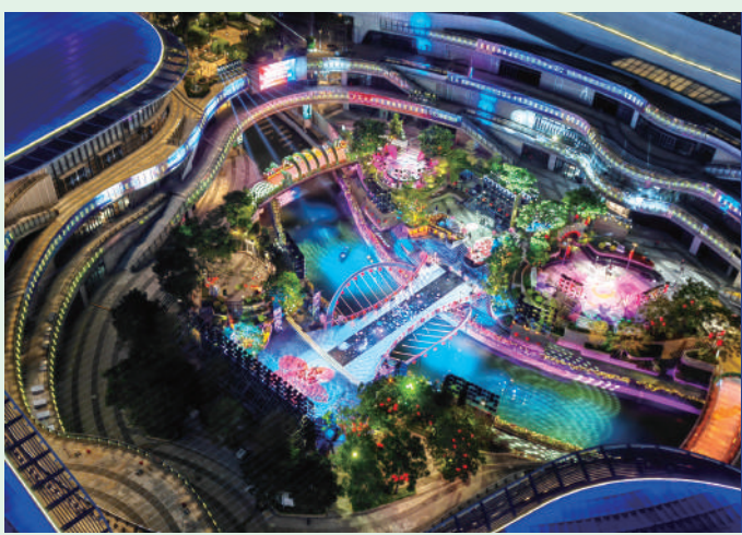
《歡樂灣區年夜飯——2023除夕特別節目》在橫琴創新方成功錄製