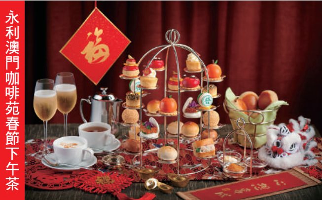
永利澳門咖啡苑春節下午茶

秉承傳統，永利將推出四款傳統賀年糕點。四款賀年糕點均選用上乘的食材並由酒店廚師精心主理，其中包括綿密惹味的瑤柱臘味蘿蔔糕和芋頭糕以及傳統的椰汁年糕和清甜的馬蹄糕。賓客可親臨永利澳門永利軒或永利皇宮甜藝廊選購賀年糕點或購買禮券餽贈親朋好友。共慶新春。新春期間，永利澳門及永利皇宮旗下多間餐廳將推出特色賀年菜式，讓賓客以繽紛美饌歡度佳節。咖啡苑亦於節日期間推出以農曆新年為主題的下午茶套餐，亦可飽。咖啡苑獨有的花園美景，一同感受喜慶節日氣氛。位於永利皇宮的米芝蓮一星及「亞洲五十最佳餐廳」粵菜食府永利宮精心炮製一系列應節賀年菜色，包括鮑魚海參撈起、網油髮菜金蟾卷等。甜藝廊更推出造型喜慶的柑柚橘子朱古力蛋糕，大紅色的蛋糕上飾以用朱古力巧手製成的賀年揮春、銅錢和年桔，甚有過年氣氛。