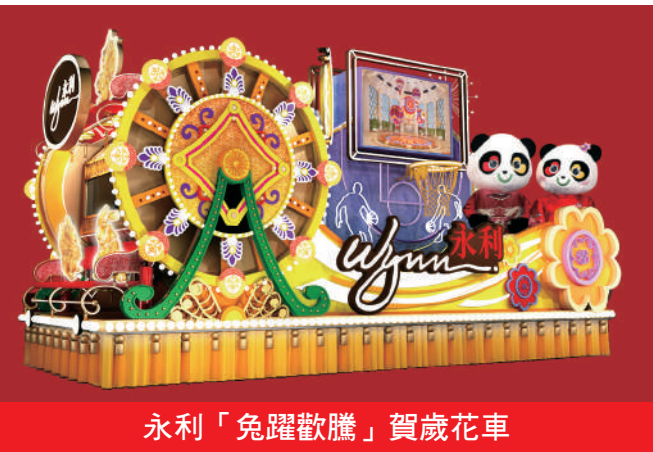
永利「兔躍歡騰」賀歲花車

豐富的項目，為節目提供了極具觀賞性、多元化的場地及硬體支持，為觀眾帶來視覺、聽覺等多感官享受。此外，也從不同側面展現大灣區文化生活的豐富多彩和多元化的交流與融合。