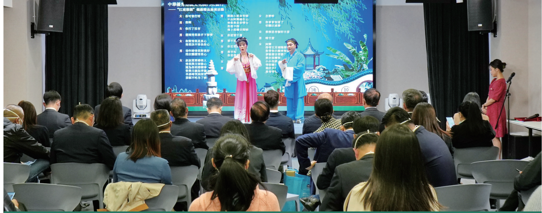
精彩展演不時獲得全場熱烈的掌聲