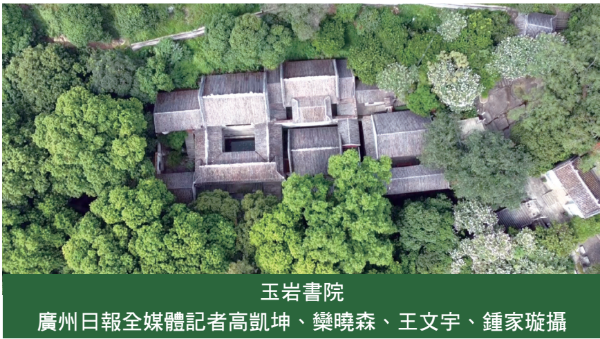
玉岩書院

古廣州知名書院 鳳山書院 玉岩書院 天關精舍 越華書院 應元書院 已成校園 廣雅書院 應元書院 新城精舍 豫章書院