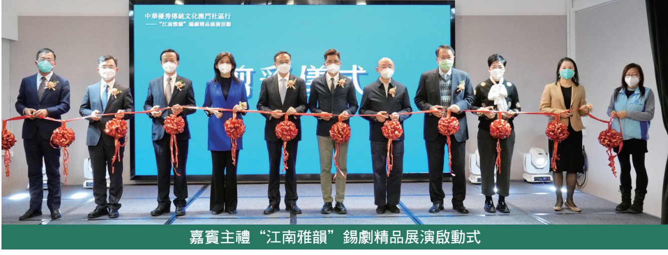
嘉賓主禮“江南雅韻”錫劇精品展演啟動式