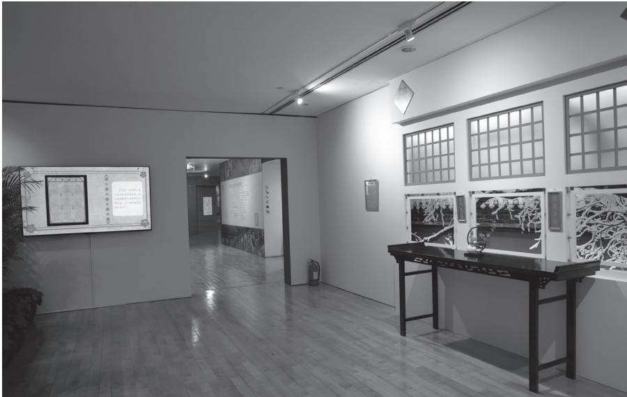
展覽內容豐富，觀眾可透過展品瞭解清代宮廷春節景象。