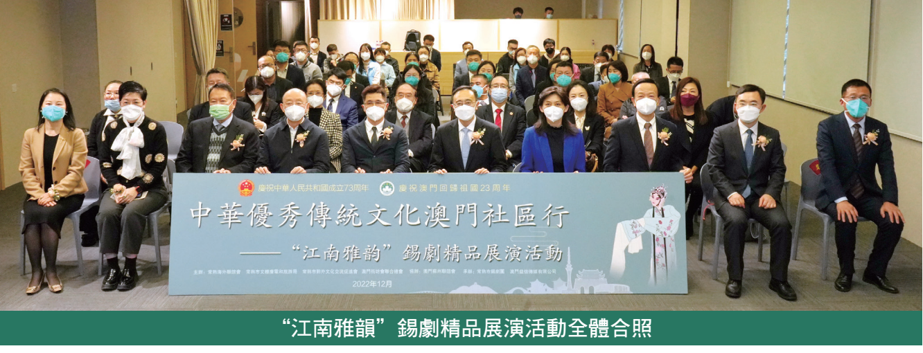
“江南雅韻”錫劇精品展演活動全體合照

在澳首辦「蘇州人才日活動」 【本報訊】蘇州海外聯誼會、蘇州市人才工作領導小組辦公室與常熟海外聯誼會日前在澳與城市大學舉辦的“人到蘇州必有為”蘇州人才日活動，分別為“谷·姑蘇社”澳城大青年創業實踐基地、“蘇澳人才會客廳”揭牌，澳城大與常熟市共建海外離岸創新中心簽署合作框架協議。 蘇州市委常委、統戰部長、蘇州海外聯誼會會長王颺，江蘇省委統戰部港澳臺處處長宋婧，蘇州市委統戰部副部長鄧兵，常熟市委統戰部常務副部長吳文進，昆山市委常委孫勇，蘇州市姑蘇區委常委王瑜，中聯辦教育部高校處處長李勇先，澳區全國人大代表劉藝良、施家倫，教育局高等教育廳代廳長岑曉東，澳城大校長劉駿等出席。 劉駿表示，本次與蘇州市合作共建“谷·姑蘇社”澳門城市大學青年創業實踐基地和“蘇澳人才會客廳”、與常熟市共建海外離岸創新中心，這一系列舉措將立足澳門，聚焦創新，輻射灣區，共同助力推進大灣區國際創新中心建設。 王颺期待蘇澳不斷拓展交流廣度和深度，開展全方位、各領域的交流合作，打造優秀人才、國際人才創業就業首選城市。通過“蘇州人才日”活動，將為兩地在高教領域的合作翻開新的篇章。