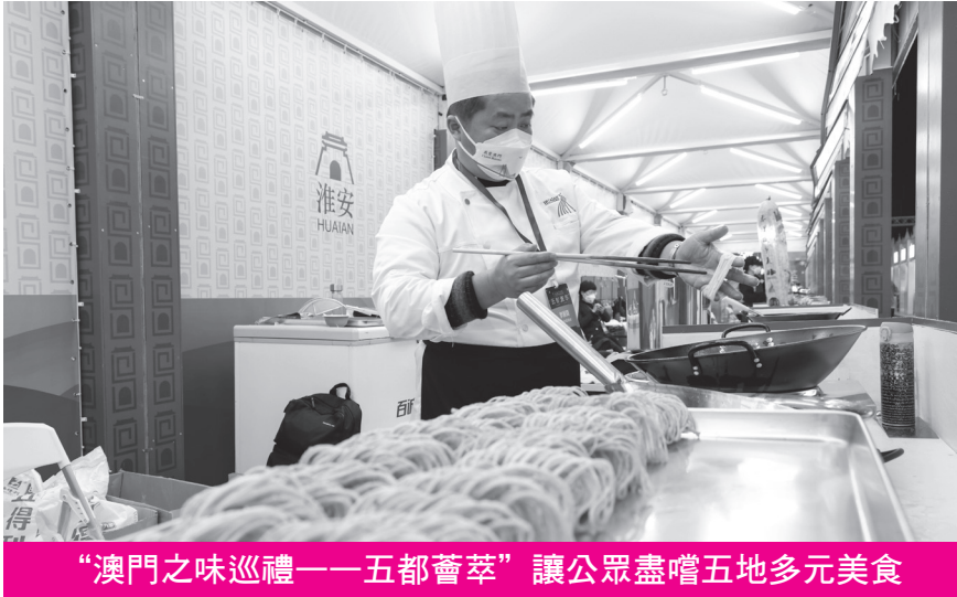
“澳門之味巡禮——五都薈萃”讓公眾盡嚐五地多元美食

活動邀得31位來自成都、順德、揚州、淮安及澳門的知名廚師到現場進行23場廚藝展示，當中的澳門名廚均來自澳門六大綜合旅遊休閒企業。廚師們將於活動期間輪番上場，即席“炮製”當地特色美食，並與居民和旅客分享烹飪秘技，展示各城市的美食文化。