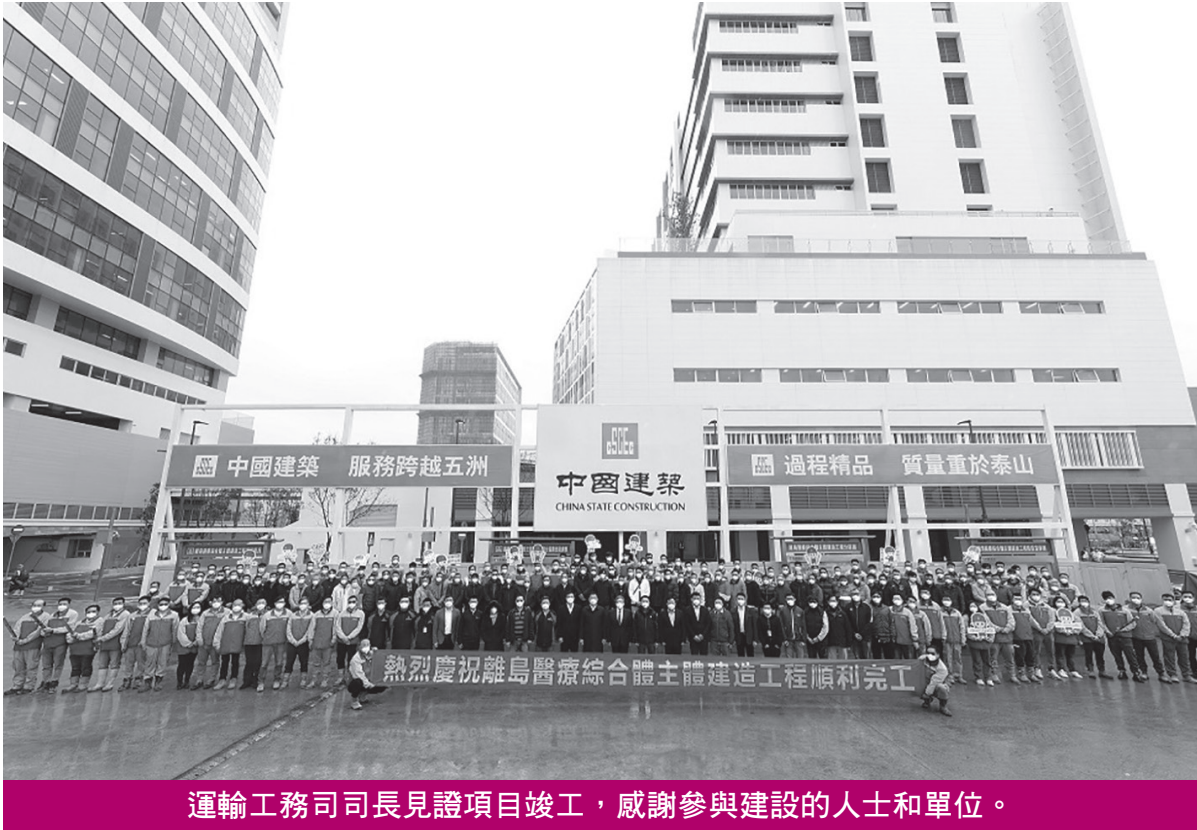
運輸工務司司長見證項目竣工，感謝參與建設的人士和單位。

【本報訊】離島醫療綜合體主體工程於日前順利竣工，並接續展開驗收程序。整個綜合體主體項目包括建造綜合醫院大樓（門診及急診）、輔助設施大樓、綜合服務行政大樓以及相關道路及基礎設施等。承建商中國建築國際集團和有利建築聯合體形容是澳門歷史上公開招標的最大民生工程，地庫開挖相當於二百六十五個標準游泳池，使用的臨時工字鋼相當於四個埃菲爾鐵塔。 離島醫療綜合體主體工程於2019年10月動工，涉及的總建築面積約276,500平方米，工程規模龐大、機電系統複雜，工程在施工期間遭遇反覆的疫情及外在環境因素的影響等，通過特區政府相關部門和各參建單位通力合作，項目順利完工。此外，項目建設期間團隊應用智慧工地系統、BIM技術輔助系統，同時加大資源投入，提高了施工效率，為項目的順利完成提供了有力保障。