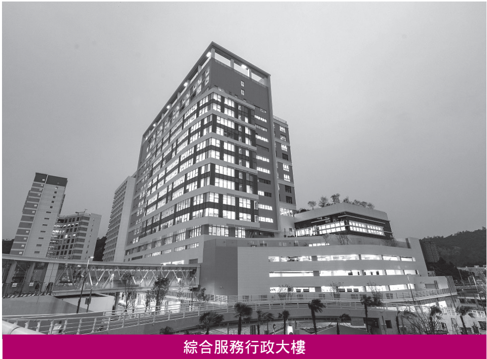
綜合服務行政大樓

【本報訊】離島醫療綜合體主體工程於日前順利竣工，並接續展開驗收程序。整個綜合體主體項目包括建造綜合醫院大樓（門診及急診）、輔助設施大樓、綜合服務行政大樓以及相關道路及基礎設施等。承建商中國建築國際集團和有利建築聯合體形容是澳門歷史上公開招標的最大民生工程，地庫開挖相當於二百六十五個標準游泳池，使用的臨時工字鋼相當於四個埃菲爾鐵塔。 離島醫療綜合體主體工程於2019年10月動工，涉及的總建築面積約276,500平方米，工程規模龐大、機電系統複雜，工程在施工期間遭遇反覆的疫情及外在環境因素的影響等，通過特區政府相關部門和各參建單位通力合作，項目順利完工。此外，項目建設期間團隊應用智慧工地系統、BIM技術輔助系統，同時加大資源投入，提高了施工效率，為項目的順利完成提供了有力保障。