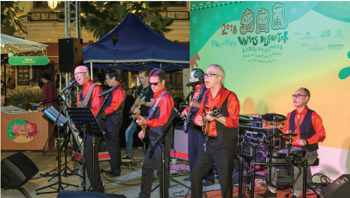
“齊齊葡”設展銷、歌舞表演、工作坊、打卡裝置等多元安排。