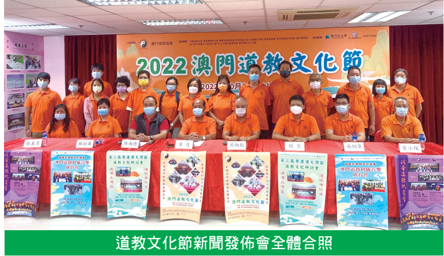
道教文化節新聞發佈會全體合照

後，澳門道樂團將分別於11月12日及13日，復辦《道德經》中學生歌唱比賽及舉辦澳門道教科儀音樂欣賞會。澳門少年道樂團及澳門少年八音鑼鼓團將在道樂欣賞會中亮相，展示澳門道教科儀音樂及澳門八音鑼鼓融進校園的碩果及年青小夥子肩負起本土音樂的責任，讓“澳門道教科儀音樂”及澳門八音鑼鼓更富有朝氣和活力，讓新傳之火持續下去。