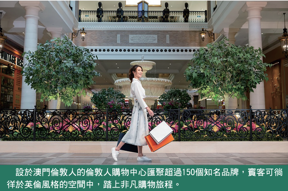
設於澳門倫敦人的倫敦人購物中心匯聚超過150個知名品牌，賓客可徜徉於英倫風格的空間中，踏上非凡購物旅程。

【本報訊】設於澳門倫敦人的倫敦人購物中心佔地超過600,000平方呎，匯聚150多間世界知名品牌商舖，包括將於11月盛大開幕的DFS旗下澳門T廣場，以及首次登陸澳門零售市場或全新升級亮相的多個著名國際品牌。賓客可跨越地域界限，徜徉於環球購物空間，體驗購物樂趣。