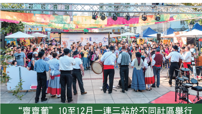
“齊齊葡”10至12月一連三站於不同社區舉行

【本報訊】為持續深耕澳門作為中國與葡語國家商貿合作服務平台的建設，多管道多元化促進中葡商貿文化交流合作的同時，帶動社區經濟的發展，澳門貿易投資促進局將分別於本年10至12月期間舉辦三場“齊齊葡—葡語國家及澳門產品特色市集”（簡稱“齊齊葡”），分別在氹仔嘉妹前地、漁人碼頭勵駿大道、中國與葡語國家商貿合作服務平台展示館舉行。