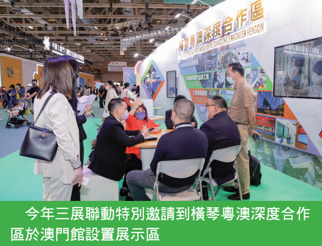
今年三展聯動特別邀請到橫琴粵澳深度合作區於澳門館設置展示區

三展著力面向“4省1市”舉辦了4場推介及考察活動，共181家來自廣東、浙江、江蘇、福建及上海的客商參與，為有關地區即將恢復赴澳旅行團及電子簽注提早“預熱”。10月21日更舉辦了“澳門會展推介會”，共有接近80位客商參加；並組織超過45名客商參加“澳門會展環境體驗之旅”，體驗會展配套設施，藉以上舉措協助業界做好迎接“4省1市”旅客的準備。