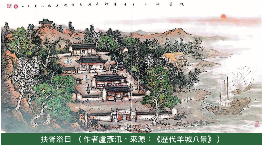
扶胥浴日（作者盧彥汛，來源：《歷代羊城八景》）