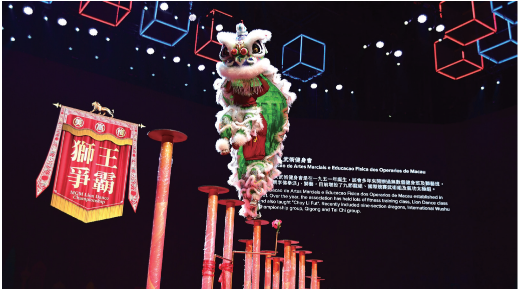
「美高梅獅王爭霸——南獅邀請賽2022」將於11月5至6日載譽回歸澳門

第9屆「美高梅獅王爭霸 - 南獅邀請賽2022」將於11月5日至6日為澳門呈獻一場歡樂又刺激的文化體育盛事。賽事免費入場，歡迎本澳市民及遊客蒞 美獅美高梅，共同見證獅王的誕生。今屆更與蓮花衛視合作設有直播，讓大眾可於線上欣賞賽事精彩盛況。