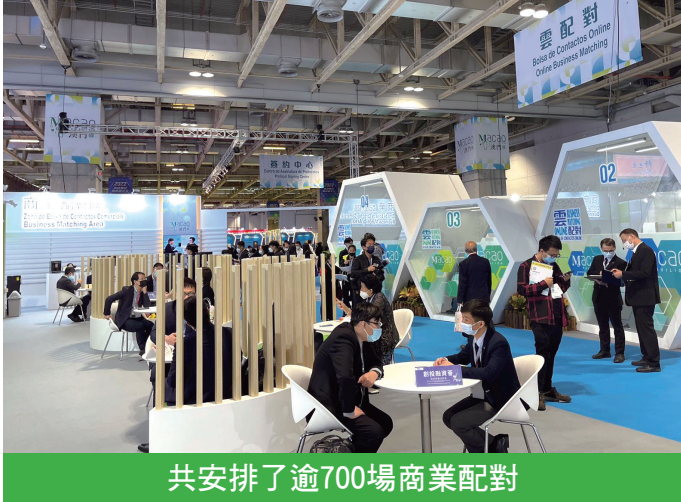
共安排了逾700場商業配對

今屆三展聚焦促進四大產業發展，共303家四大產業企業參展，舉行了56場相關主題活動，為澳門打造更多元化的產業基礎。當中，第27屆MIF增加至3個的“展中展”，包括約3,000平方米的“2022中國中醫藥健康（澳門）品牌展覽會”、約900平方米的“2022中國（澳門）國際文化創意產業博覽會”以及約3,200平方米的“2022