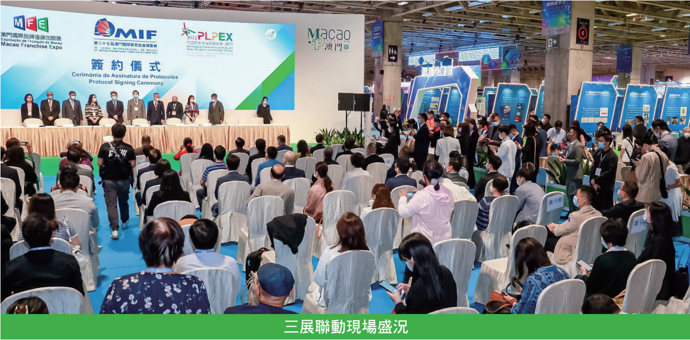
三展聯動現場盛況