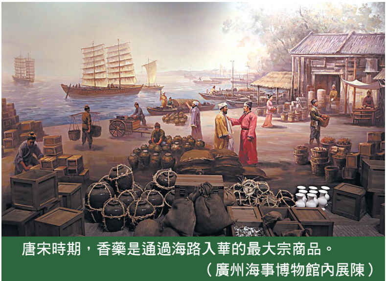
唐宋時期，香藥是通過海路入華的最大宗商品。（廣州海事博物館內展陳）