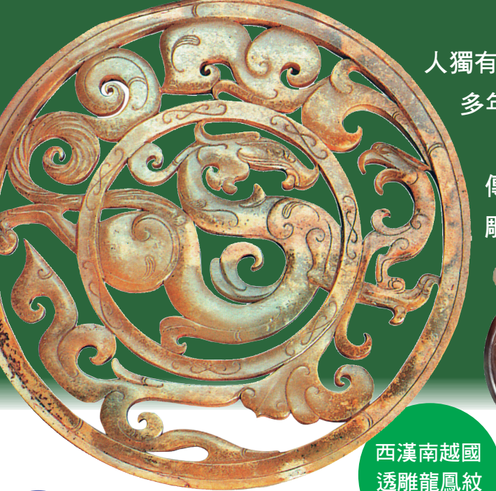
西漢南越國透雕龍鳳紋重環玉佩

【轉自廣州日報】從古到今，有關玉的故事貫穿於中國發展的整個歷史，而玉石的雕刻，中國人獨有的雕刻技藝也伴隨著歷史的演進源遠流長。廣州玉雕工藝形成於唐代中後期，走過了一千五百多年歷史。