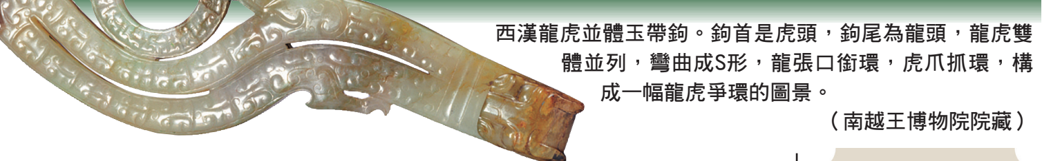
西漢龍虎並體玉帶鉤。鉤首是虎頭，鉤尾為龍頭，龍虎雙體並列，彎曲成S形，龍張口銜環，虎爪抓環，構成一幅龍虎爭環的圖景。（南越王博物院院藏）

雖叫廣州玉雕，但廣州卻不產玉，讓廣州玉雕聞名於世的是廣州玉雕技藝傳承人，在古法傳統雕刻基礎上代代相傳與發揚光大，在品種、工藝、用料等方面創造出獨特的廣式風格，讓玉雕界的“廣州匠”享譽天下。中華人民共和國成立後，廣州玉雕綻放真正的繁榮景象，與北京、上海、揚州玉雕並列為中國玉雕“四大派”。其風格典雅秀麗、輕靈飄逸。廣州玉雕有著深厚的歷史積澱，成為迷人的嶺南藝術瑰寶，二零零八年被列入國家級非物質文化遺產名錄。