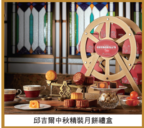
邱吉爾中秋精裝月餅禮盒