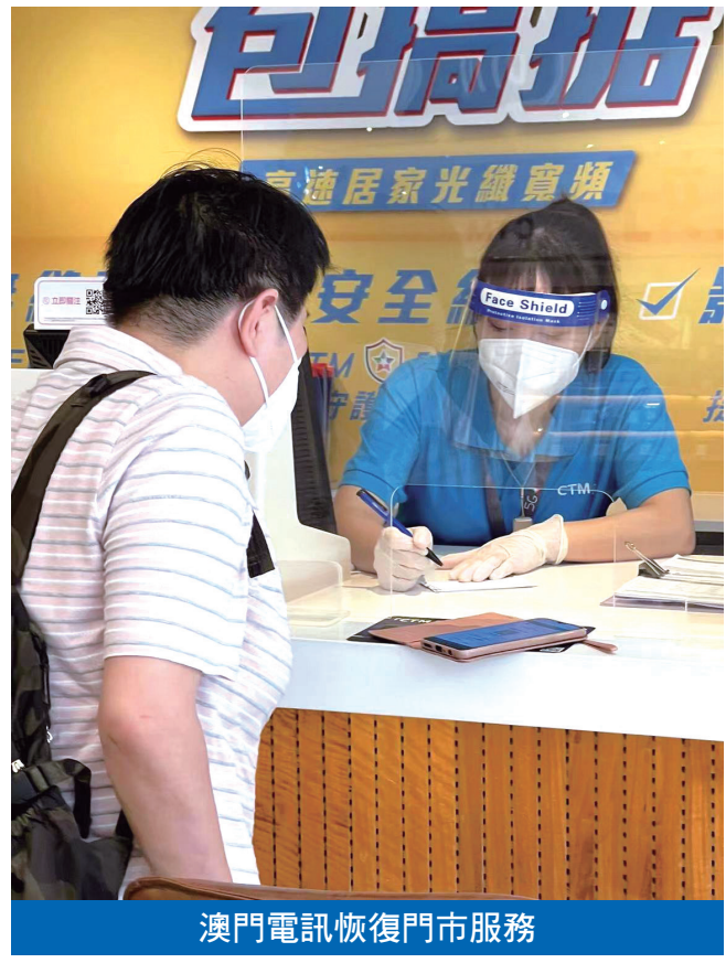
澳門電訊恢復門市服務

臺www.ctm.net或致電服務第一熱線1000查詢、申請或辦理服務。有關繳費方面，客戶可透過線上方式或前往便利店進行繳付，線上繳費同樣接受電子消費券。在保障員工健康安全的前提下，澳門電訊會調配充沛的人力資源，竭力履行通訊把關人的責任，確保澳門整體通訊網絡穩健運行和服務的高質量提供，支援社會各界對網絡服務的需求。