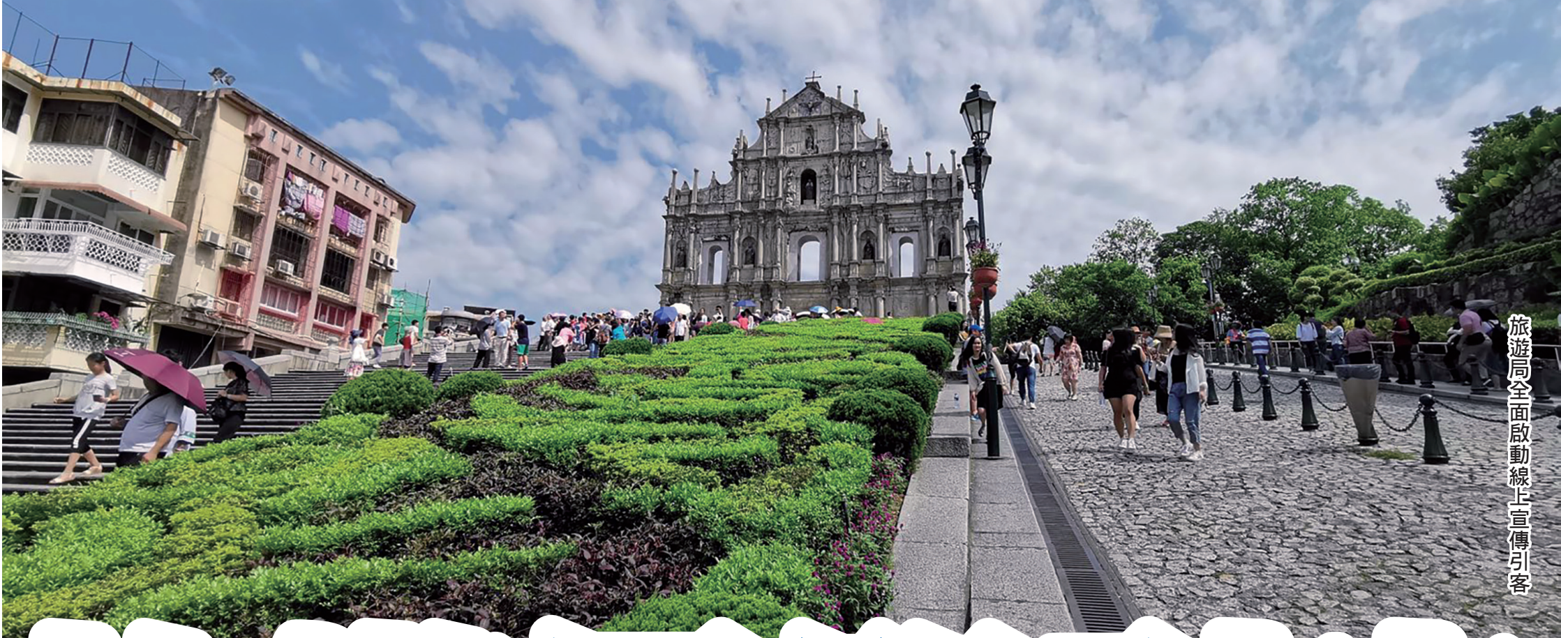
旅遊局全面啟動線上宣傳引客