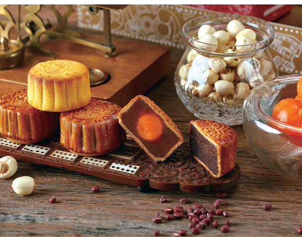
邱吉爾餐廳首度推出中秋限定月餅

賓客可於2022年8月15日至9月10日期間在澳門倫敦人邱吉爾餐廳零售商店換領月餅，並可於8月28日或之前尊享早鳥及大量訂購優惠。