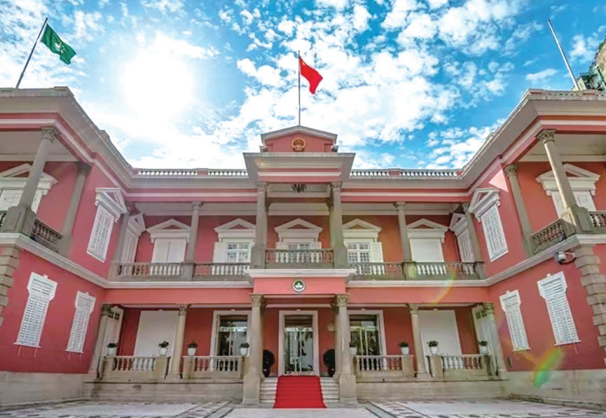
澳門特別行政區政府

【本報訊】特區政府日前發聲明表示在台灣問題上的立場一以貫之，堅決維護中國國家主權和領土完整，堅守一個中國的原則。美國眾議院議長佩洛西竄訪中國台灣地區，是對中國內政的粗暴干涉，嚴重損害中國主權和領土完整，肆意踐踏一個中國原則，嚴重威脅台海和平穩定，嚴重破壞中美關係，特區政府予以強烈譴責。 台灣問題是中美關係間最重要、最敏感的核心問題，本屆美國政府多次在台灣問題上作出堅持一個中國原則的承諾，但美方近期一些言行與此背道而馳。特區政府堅決反對任何外部勢力干預中國事務，並全力支持和配合國家捍衛自身主權和領土完整的堅定決心，堅定維護國家主權、安全和發展利益。