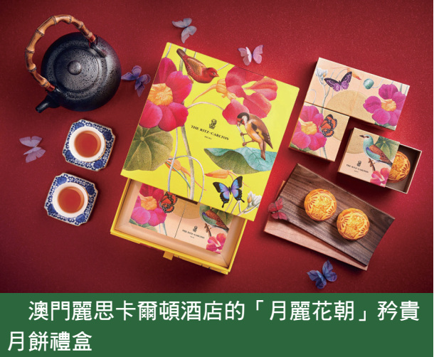
澳門麗思卡爾頓酒店的「月麗花朝」矜貴月餅禮盒

甘香柔滑的奶黃，令人回味無窮。 「月麗花朝」矜貴月餅禮盒每盒售價澳門幣598元，由2022年8月3日至9月10日，於澳門麗思卡爾頓酒店供應。澳門居民及外地僱員身份認別證持有人由即日起至8月31日預訂，即可專享85折優惠。此外，酒店亦提供75折至8折的量購優惠（詳情請參閱附件）。 查詢或訂購，請致電+853 8886 6868或電郵至 rc.mfmmr.leads@ritzcarlton.com。