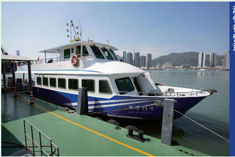
內港往來灣仔海上客運航線今日起恢復營運

【本報訊】內港客運碼頭往返灣仔的海上客運航線，將於今日（週五）起恢復營運。復航初期，客船班期為每半小時一班，並會按實際情況加開航班，具體票務情況可向船公司查詢。 海事及水務局提醒，乘客在出行前應瞭解粵澳兩地的最新出入境防疫措施，然而由於鄰近地區疫情仍未穩定，建議市民減少不必要的跨境活動。局方亦已要求船公司、碼頭清潔、保安外判公司加強碼頭內公共設施和船隻的清潔消毒。