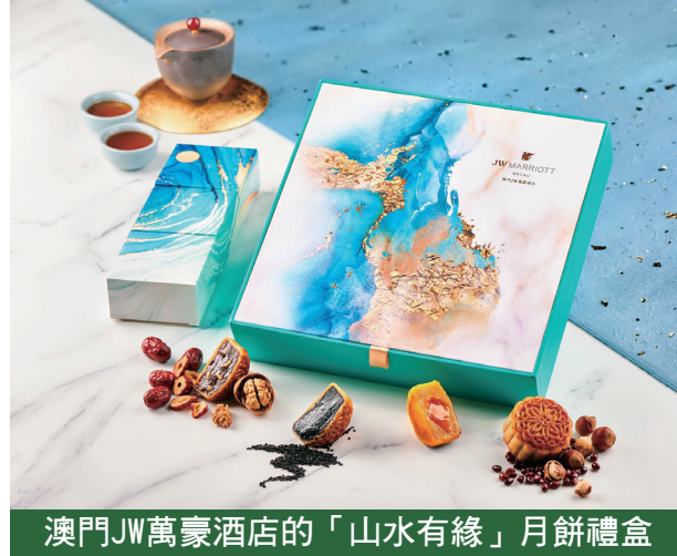
澳門JW萬豪酒店的「山水有緣」月餅禮盒

澳門麗思卡爾頓酒店推出的「月麗花朝」矜貴月餅禮盒，共有8件迷你奶黃月餅，鬆香外皮包裹