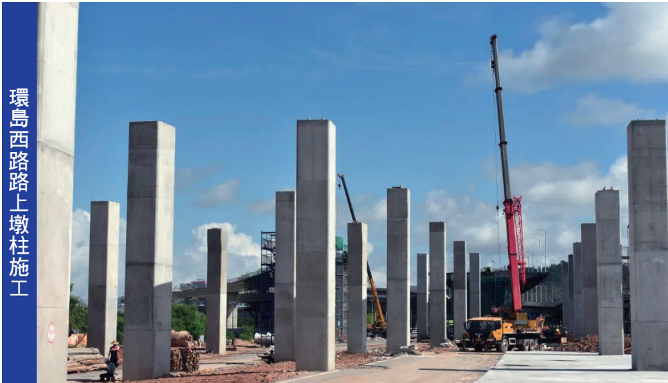
環島西路上墩柱施工