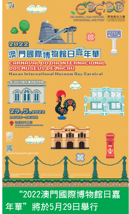
“2022澳門國際博物館日嘉年華”將於5月29日舉行

2022澳門國際博物館日嘉年華的主辦機構包括：天主教藝術博物館與墓室、中西藥局舊址、同善堂歷史檔案陳列館、冼星海紀念館、澳門林則徐紀念館、典當業展示館、消防博物館、海事博物館、通訊博物館、路氹歷史館、聖若瑟修院藏珍館、葉挺將軍故居、鄭觀應紀念館、澳門大賽車博物館、澳門回歸賀禮陳列館、澳門保安部隊博物館、澳門科學館、澳門博物館、澳門藝術博物館及龍環葡韻。各博物館將嚴謹按照衛生部門相關防疫指引，作出妥善安排，為配合特區政府防疫工作，參與的市民必須佩戴口罩、接受體溫探測，掃描行程記錄的場所二維碼（簡稱場所碼）及出示健康碼，保持適當社交距離，並配合有關防疫及現場的人流措施安排。