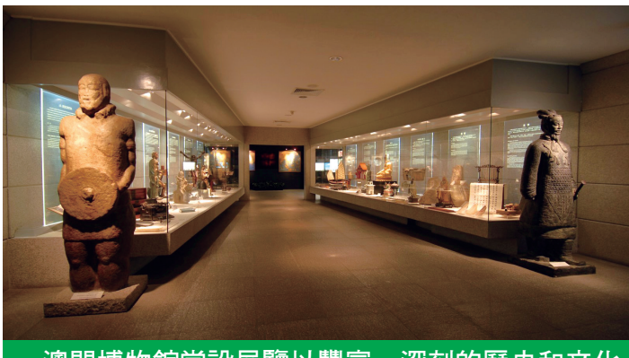
澳門博物館常設展覽以豐富、深刻的歷史和文化內涵，展示澳門，特別是近數百年來中西文化交匯的歷史，以及對中國近代史的影響。