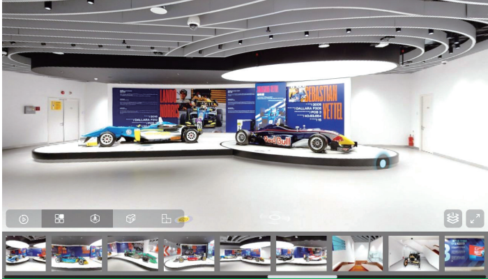
澳門大賽車博物館最近新增360環景導覽