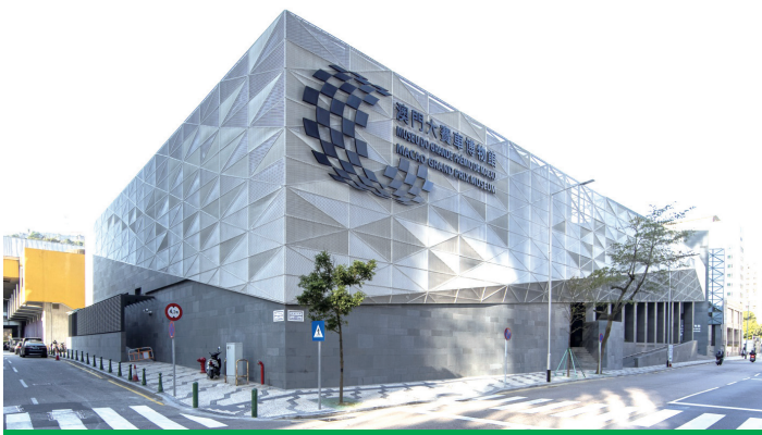
澳門大賽車博物館響應“國際博物館日”