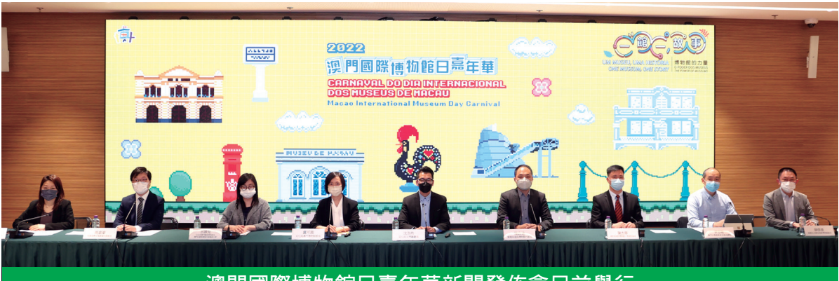
澳門國際博物館日嘉年華新聞發佈會日前舉行

嘉年華於5月29日（星期日）下午2時至6時舉行，活動當日各博物館設有豐富的活動，活動詳情及參加方式可瀏覽“澳門的博物館”網站（ www.museums.gov.mo ），當中包括攤位遊戲：博物館展品熱縮片匙扣、量一“涼”、秤一秤——傳統購物體驗坊、祐漢辦公室尋寶、回歸賀禮尋寶、“尋香之旅”——海上香料貿易、禁寄你要知、電路賽道以及與冼星海紀念館元素相關的“頂硬上，鬥長氣”等；還設有工作坊包括夢回澳門記憶（祐漢區）和文化導賞遊等。此外，大會更邀請廣東省文化和旅遊廳及其轄下博物館參與活動，香港康樂及文化事務署亦將設置宣傳展架。5月各館於指定時間免費開放予