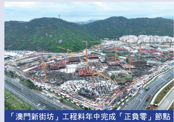
「澳門新街坊」工程料年中完成「正負零」節點

【本報訊】橫琴「澳門新街坊」項目樁基礎工程已於去年底完成，現正進行地下室底板施工，預計年中完成至「正負零」節點（完成全部地下室結構）。同時，項目內幼稚園及小學建設工程於3月全面啟動，衛生站、長者服務中心、家庭綜合服務中心亦同步建設，預計住宅樓宇及民生配套在2023年中竣工驗收。