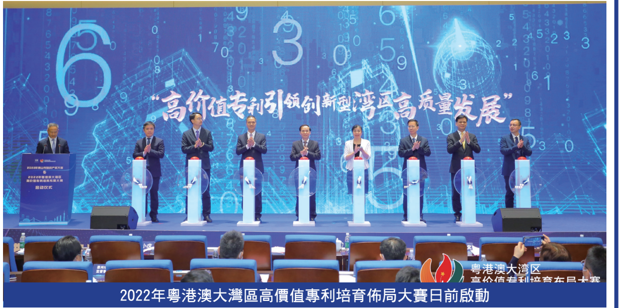
2022年粵港澳大灣區高價值專利培育佈局大賽日前啟動

灣高賽報名系統現已開啟，報名截止日期為2022年6月20日。有意參賽者可登入大賽官方網站（ https://ghm.7ipr.com ）了解比賽詳情及報名參賽。