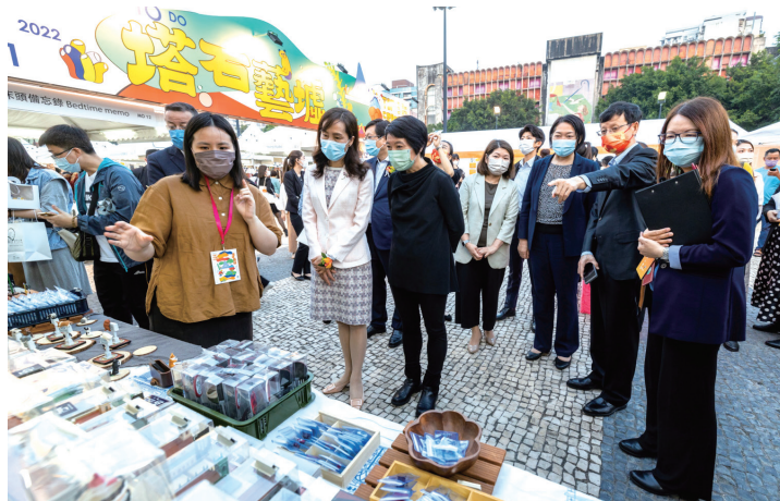
主禮嘉賓遊覽塔石藝墟攤位感受文創魅力

她表示，“塔石藝墟”作為《粵港澳大灣區文化和旅遊發展規劃》的文化創意發展項目，文化局將持續優化活動內容，期望將其打造成為大灣區文化產業品牌盛事，並計劃今年組織本澳手作人到大灣