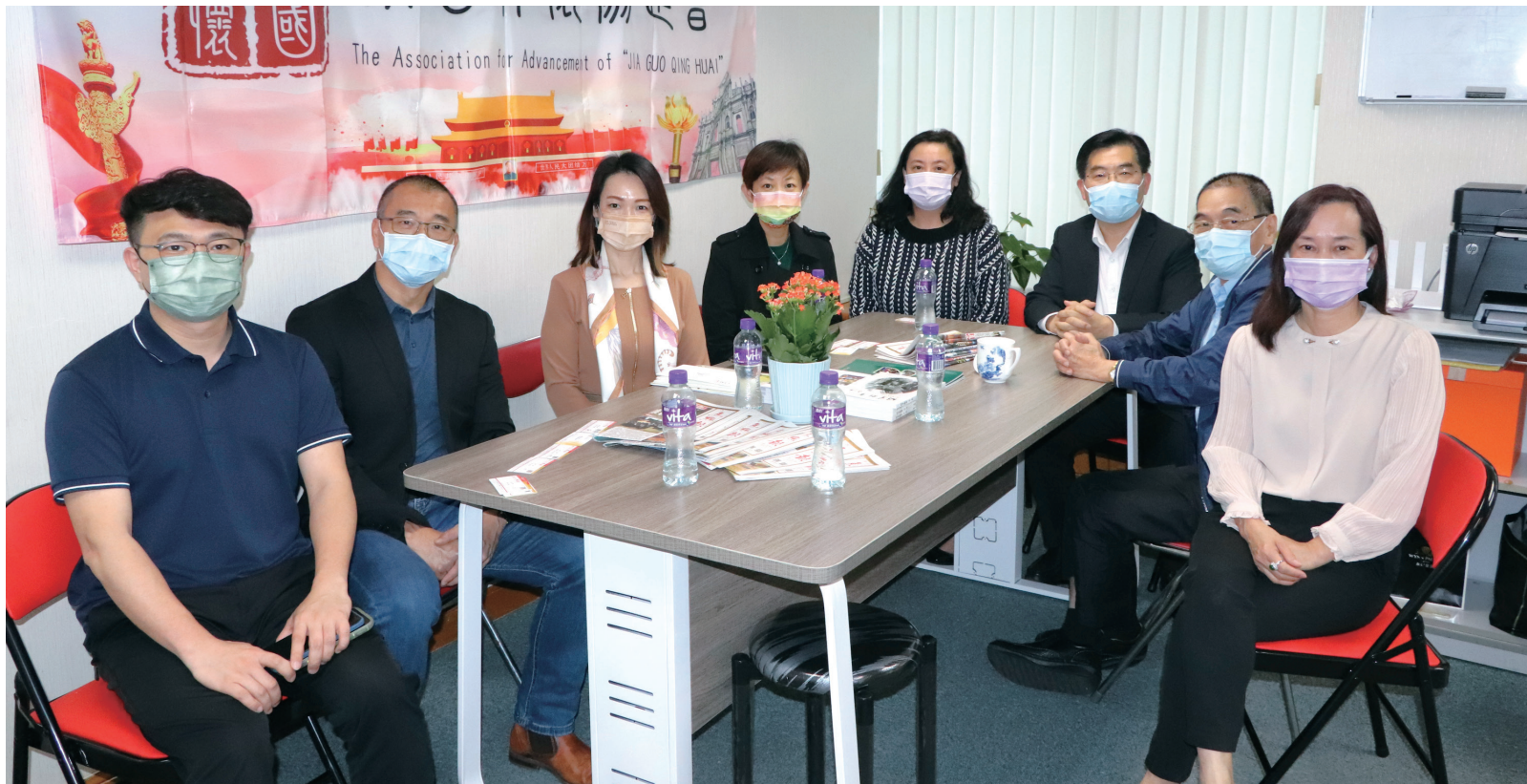
澳門電訊一行到訪本報進行座談交流