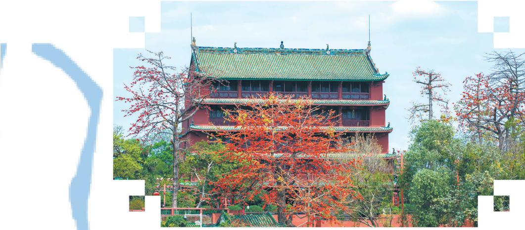
鎮海樓與“三塔”遙相呼應，形成古代廣州的城市格局。