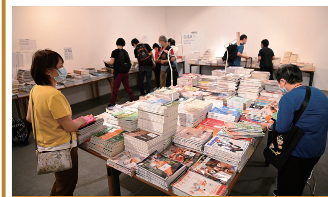
“好書交換”及“期刊熱賣”深受市民歡迎並踴躍參加

【本報訊】由文化局、教育及青年發展局、澳門大學圖書館、澳門圖書館暨資訊管理協會聯合主辦的2022年“澳門圖書館周”，將於明日上午10時30分在