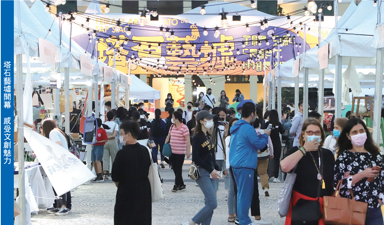
塔石藝墟開幕 感受文創魅力

塔石藝墟活動時間為周四及周五下午5時至晚上10時；周六及周日下午3時至晚上10時，工作坊已獲抽籤錄取的市民敬請準時出席。活動詳情可瀏覽塔石藝墟專頁www.craftmarket.gov.mo、藝墟臉書專頁www.facebook.com/MacaoCraftMarket或文化局網站www.icm.gov.mo。查詢可於辦公時間致電8399 6289或8399 6292與周小姐或廖小姐聯繫。