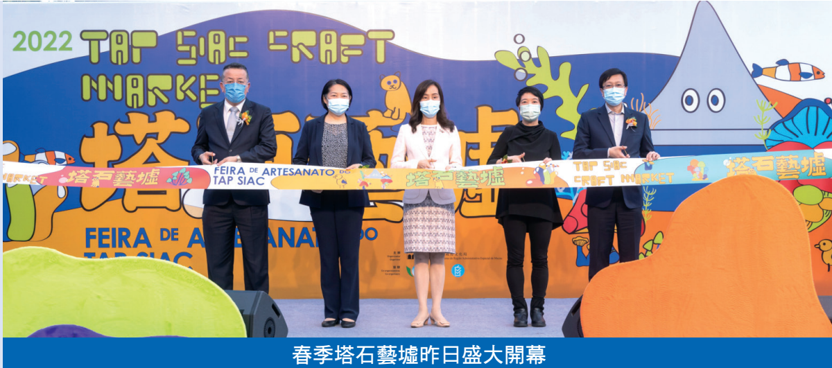
春季塔石藝墟昨日盛大開幕

焦點新聞 由文化局主辦的春季塔石藝墟於昨日假塔石廣場盛大開幕，第一階段持續至4月24日，第二階段從4月28日至5月1日。是次塔石藝墟雲集逾百文創品牌的原創商品，活動內容豐富多彩，活動期由每周3日增至4日，緊接一連兩周的星期四至日在塔石廣場舉行，每周設有逾百個特色手作及創意飲食攤位，展示及銷售涵蓋生活用品、衣物配飾、手工藝品、手製天然產品等風格多樣的文創商品。塔石藝墟將為觀眾帶來多場澳門及內地歌手的精彩音樂表演和創意手作坊，讓市民感受別具特色的休閒文旅體驗。