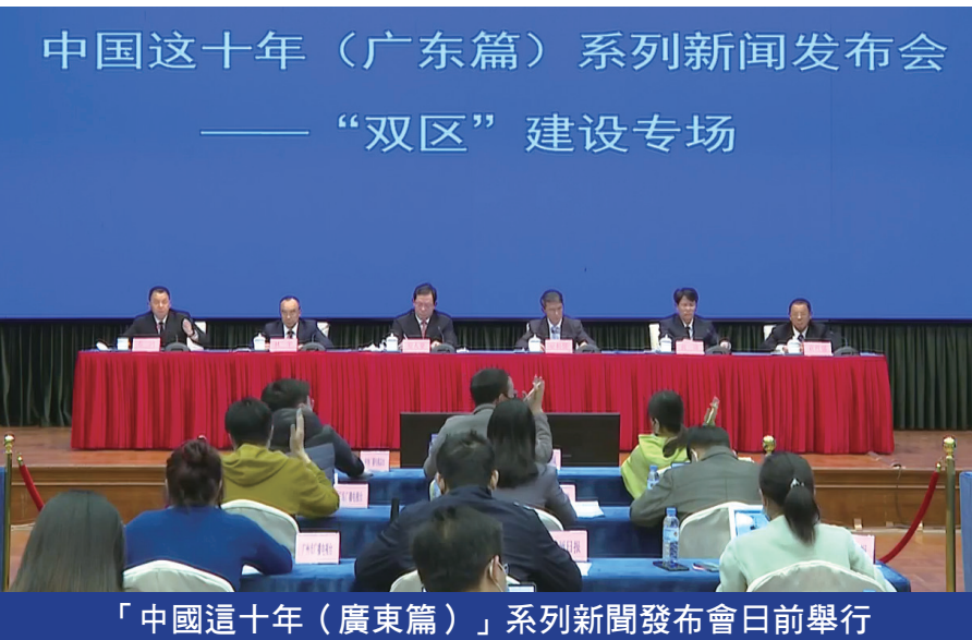
中国这十年（广东篇）系列新闻发布会——“双区”建设专场

四是社會民生領域加快融合。聚焦澳門居民最關心最直接最現實民生問題，全力推進規則銜接、機制對接，著力營造趨同澳門的宜居宜業生活環境，澳門居民在合作區生活就業更加便利。「澳門新街坊」項目加快建設，可為澳門居民提供4,000套住房。