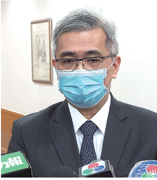
黃少澤：利用探親簽當水客將禁入境一年

【本報訊】保安司司長黃少澤日前表示，就中山市坦洲鎮新冠病毒陽性個案涉嫌利用探親簽註，多次往返珠澳兩地從事水客活動，治安警察局初步決定禁止該名人士入境一年，並將對同類人士採取相應處罰。當局會繼續與內地緊密溝通，打擊水客活動。