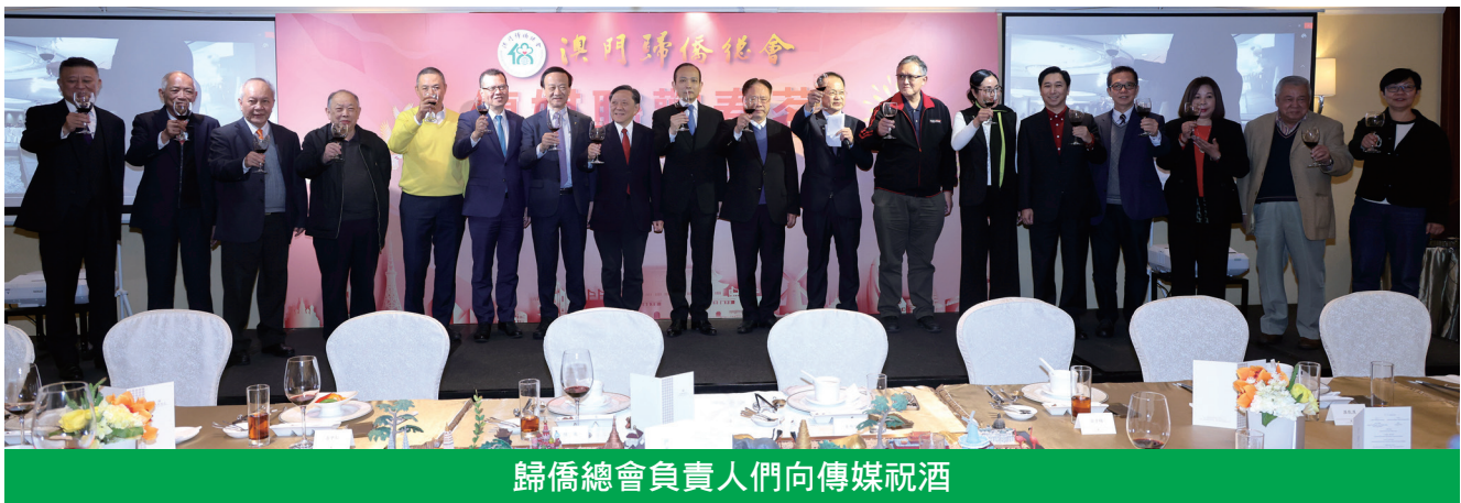
歸僑總會負責人向傳媒祝酒

主辦方補充指屆時會做好各項防疫工作，並呼籲前往善心有序進廟上香，與他人保持一米距離，配合工作人員測量體溫及出示澳門健康碼。是次活動得到旅遊局、文化局、市政署、消防局、治安警察局、交通局、澳門基金會以及社會各界的賢達等支持。