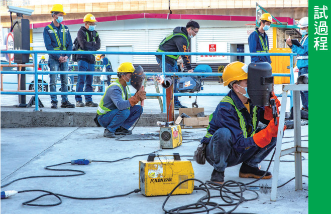
勞工局派員監察建築工友面試過程

綜合多次配對會的數據來看，求職者對轉介工作不感興趣的原因，可歸納為未能適應就業市場的變化，仍未做好轉換工作的心理準備。為此，勞工局將推出「新出發」就業講座，內容由三個部份組成，分別是市場需求分析、求職及減壓技巧，以及職業培訓資訊，以協助求職者調整心態並重新迎接新工作的挑戰。 為讓青年進一步認識高新科技、智能製造、中醫製藥及現代金融等新興產業的發展概況、就業環境及人資需求，勞工局透過「職問職講」系列式講座，2022年首兩個月，按月先後舉辦了“AI賦能企業新生態”及“與