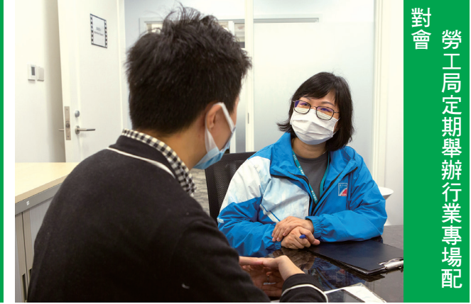
勞工局定期舉辦行業專場配對會

勞工事務局會繼續密切關注勞動市場狀況及“帶津培訓計劃”之推行，並加強與不同行業團體合作，因應行業人員在就業及轉職上的需要，為業界開拓及推出更多類型的職業培訓課程，全力協助澳門居民提升職業技能及投入就業市場。