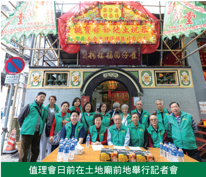
雀仔園舉行賀土地誕

至於全面開放澳門機動車便利進出橫琴，黃少澤表示，目前申請配額每月有500個，現時口岸正在進行工程，不可能無限制開放，要等待橫琴口岸二期工程完成才可與內地磋商。