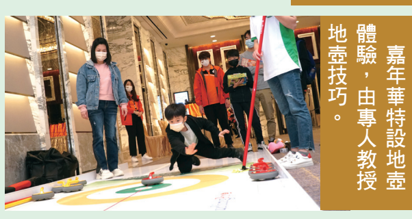
嘉年華設有八個不同主題的親子工作坊，參加者盡享幸福親子時光。