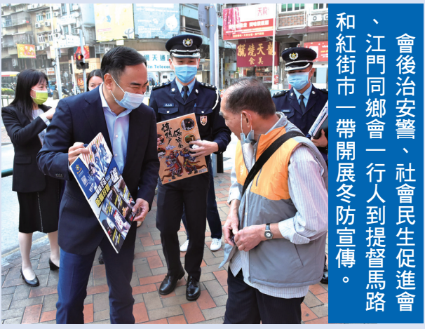
會後治安警、社會民生促進會、江門同鄉會一行人到提督馬路和紅街市一帶開展冬防宣傳。