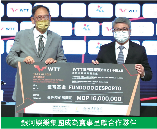
銀河娛樂集團成為賽事呈獻合作夥伴

有意購買門票的人士可於1月5日早上11時起至1月18日親臨澳門10間指定的OK便利店(黑沙環南藝閣、關閘信達、皇朝中士、南灣一定好、十六鋪、海濱花園、運順新村、荷蘭園、太子花城、百老匯)購票，或登陸www.sport.gov.mo/WTTmacao2021/ticketing進行網上定票，又或於1月19日至23日在塔石體育館現場購買。每張門票可觀看當天的所