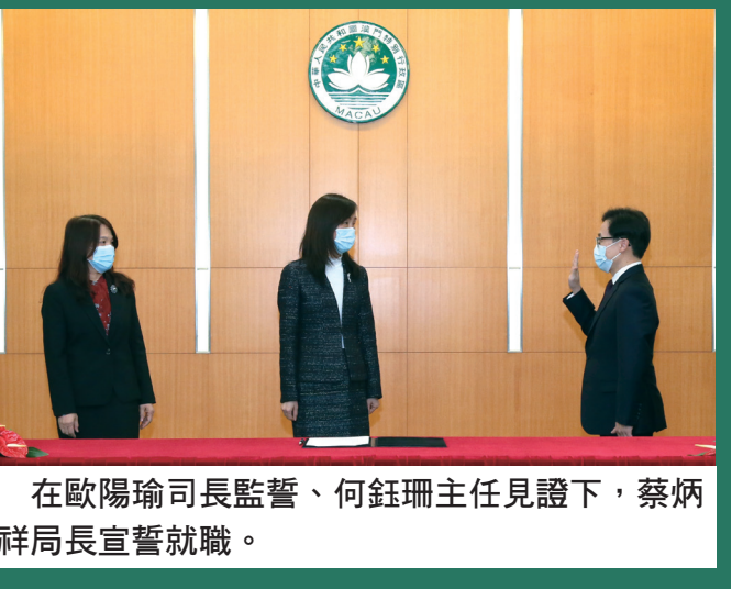
在歐陽瑜司長監督、何鈺珊主任見證下，蔡炳祥局長宣誓就職。

繼續開來，開拓更廣、更闊和更專業的藥物監督管理工作，達致特區政府的施政目標。同時將有序落實多項新政策和措施，包括執行《中藥藥事活動及中成藥註冊法》及研究小型醫療器械註冊制度等。蔡炳祥表示會不忘初心，以維護和促進公眾健康為使命，以科學實證為基礎，依法嚴格把關，保障藥物安全有效、質量可控，並會全面落实藥物全生命週期管理，推動和支持包括中醫藥在內的大健康產業健康有序地發展。任內會盡力做好人力組建、人才培養和儲備，以構建優質的藥物監督管理體系。在社會文化司司長的領導下，他本人會和團隊踏實前行，盡心盡力為居民服務。