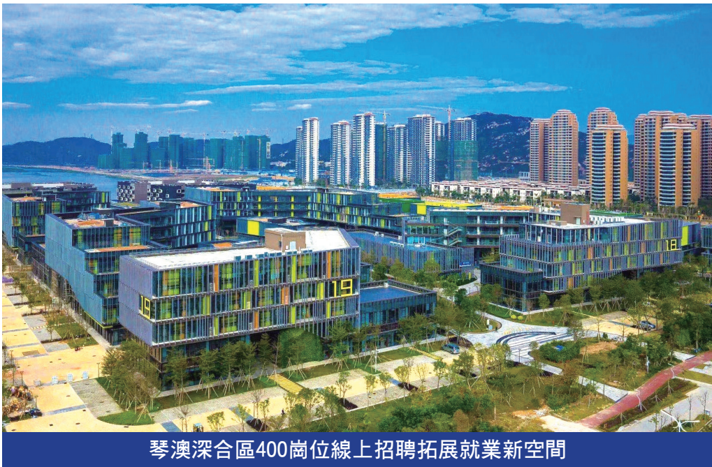
琴澳深合區400崗位線上招聘拓展就業新空間

有興 趣 前 往深合區發展的澳門居民，可透過勞工局網站新設的“橫琴粵澳深度合作區就業”專頁（ https://www.dsai.gov.mo/bayarea/zh_tw/standard/employment_hengqin.html ）了解活動章程後，掃描二維碼前往“橫琴英才招聘”微信公眾號登入活動承辦平台。在“澳門居民招聘”專區選定心儀崗位後上傳個人簡歷，後續應聘對接事宜，則由深合區企業直接與應徵者聯繫跟進。