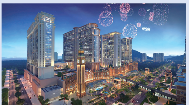
澳門倫敦人夜景外觀

澳門倫敦人酒店的設計結合了現代風格和經典英式元素，配以舒適設施和典雅的藝術藏品，將倫敦精髓——展現。酒店設有約600個房間，均為全