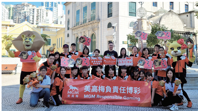
美高梅與博彩業職工之家合辦「美高梅x職工之家——『瘋』家『輸』負責任博彩主題路演」。

青年會及博彩業職工之家等社福團體合辦多場路演宣傳，如「MGM x義青一負責任博彩路演」及「美高梅x職工之家——『瘋』家『輸』負責任博彩主題路演」等，旨在把負責任博彩資訊帶進社區，豐富市民及遊客的相關知識。此外，公司更聯同上述機構推出多場工作坊、專題研討、多媒體推廣及親子活動等多元化教育活動，以有趣互動方式，讓更多群眾充分掌握有節制博彩的必要性，以及博彩活動的潛在風險。