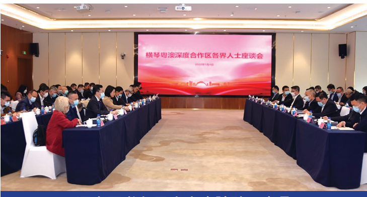
深合區邀各界人士座談聽取意見

深合區執委會強調，今年是深合區深入推進、加快建設的關鍵之年，深合區執委會、廣東省委橫琴工委和省政府橫琴辦將深入落實《總體方案》部署，堅守“一國”之本、善用“兩制”之利，立足分線管理的特殊監管體制和發展基礎，圍繞促進澳門產業多元發展主攻方向，率先在改革開放重要領域和關