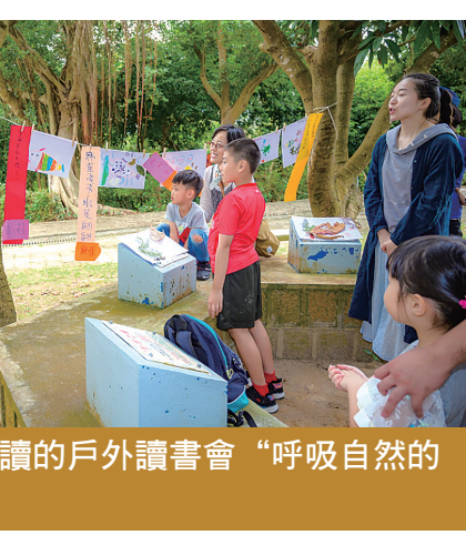
結合山藝與閱讀的戶外讀書會“呼吸自然的山林閱讀”