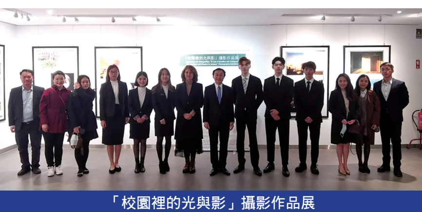
「校園裡的光與影」攝影作品展

於人們聚集，活動頻繁，更加上Omicron變異病毒傳染極快，比原來Delta病毒傳染更迅速，現時每日新增確診個案超過2萬人，9成病人是由Omicron變異病毒所致。澳門駐里斯本經濟貿易辦事處嚴格遵守葡萄牙政府衛生部門防疫規定，執行嚴謹的公共衛生政策，禁止眾人集結及在家中工作等指