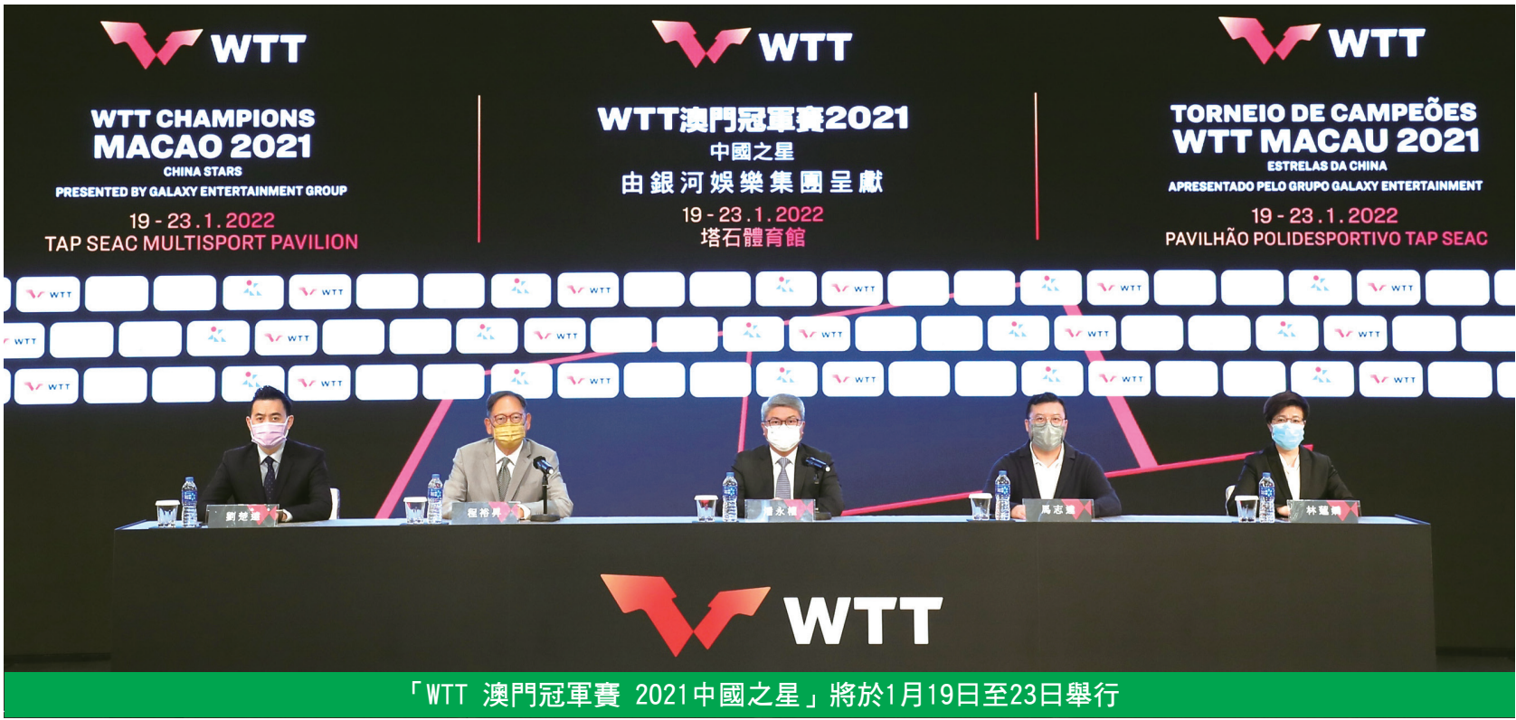
「WTT 澳門冠軍賽 2021中國之星」將於1月19日至23日舉行

為確保賽事能安全的進行，賽事舉行期間將會嚴格執行防疫措施。主辦單位將繼續密切留意疫情的發展，並根據衛生局發出的相關指引適時就賽事作出防疫安排。