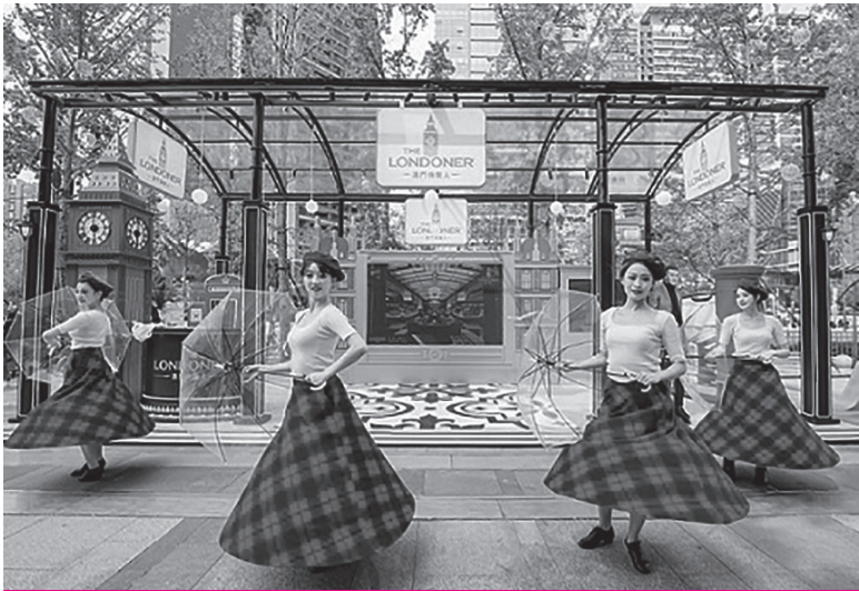
澳門倫敦人矚目亮相“四川·成都澳門週”大型路展

【本報訊】為吸引內地旅客赴澳旅遊及消費，助力本澳旅遊經濟復甦，澳門金沙度假區參與於9月23至27日在成都高新區交子廣場舉辦的「四川·成都澳門周」大型路展活動；活動期間通過線上線下不同渠道向當地居民呈現澳門「旅遊+」魅力。 是次「四川·成都澳門周」推廣活動由澳門特區政府多個部門及多家企業機構為當地市民帶來總