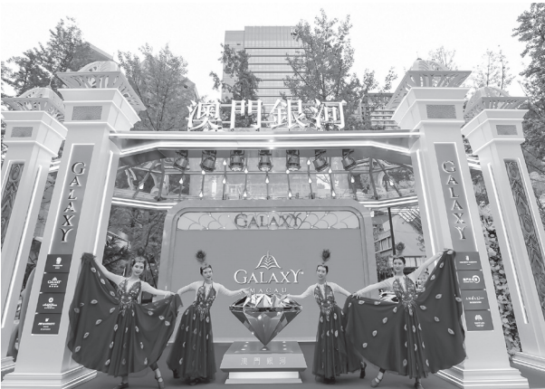
「澳門銀河」展位完美呈現了度假城標誌性的金色穹頂裝飾和運財銀鑽，令現場觀眾近距離感受「澳門銀河」的恢弘氣派以及鑽石大堂高達3米巨鑽的璀璨閃耀。

此次「四川·成都澳門周」活動，「澳門銀河」通過匠心打造的展位及精彩紛呈的表演，為現場觀眾呈現多元旅行體驗，彰顯其在「旅遊+」跨界體驗的無限可能。無論是「澳門銀河」展位呈現的度假城金色穹頂裝飾和運財銀鑽，還是寓意吉祥與幸運的《如意孔雀舞》，均令現場觀眾如身臨其境