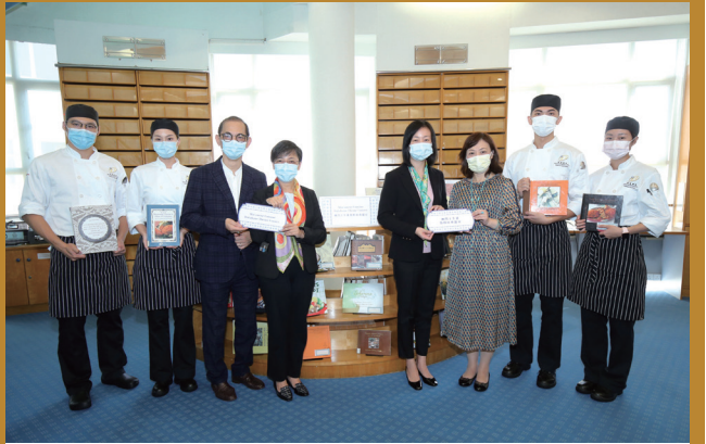
澳旅院成為國家級非物質文化遺產保護單位

【本報訊】日前國家文化和旅游部辦公廳公佈第五批國家級非物質文化遺產代表性專案保護單位名單，澳門旅遊學院成為澳門特別行政區申報“土生葡人美食烹飪技藝”國家級非物質文化遺產項目VIII-280之保護單位。“土生葡人美食烹飪技藝”作為澳門四百多年來中西文化交匯之重要歷史產物，其獨特的文化傳承彰顯了小城四百多年來在經濟、社會、民生及人口組成的變遷。作為國家級非物質文化遺產，“土生葡人美食烹飪技藝”豐富了澳門身為“創意城市美食之都”的軟實力，同時亦擴寬了本澳的旅遊資源。 澳門旅遊學院作為國家級非物質文化遺產之保護單位，未來將繼續開來，依照《中華人民共和國非物質文化遺產法》及《關於進一步加強非物質文化遺產保護工作的意見》要求，貫徹“保護為主、傳承發展”的工作方針，認真做好國家級非物質文化遺產代表性專案保護單位之工作。澳門旅遊學院酒店管理