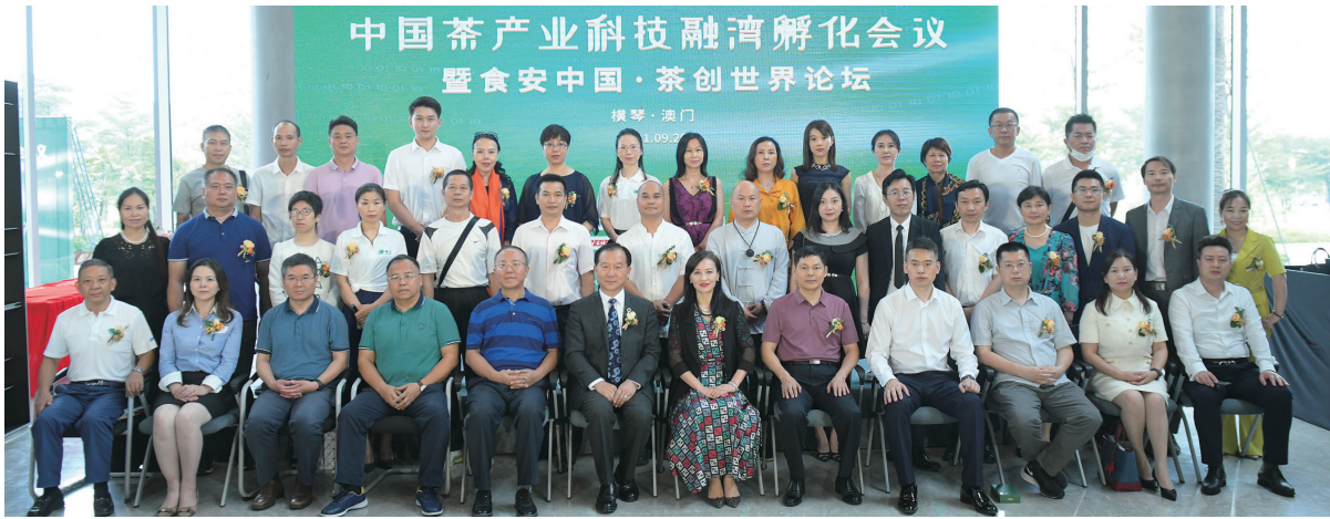
中國茶產業科技融灣孵化會議暨食安中國·茶創世界論壇出席嘉賓合照