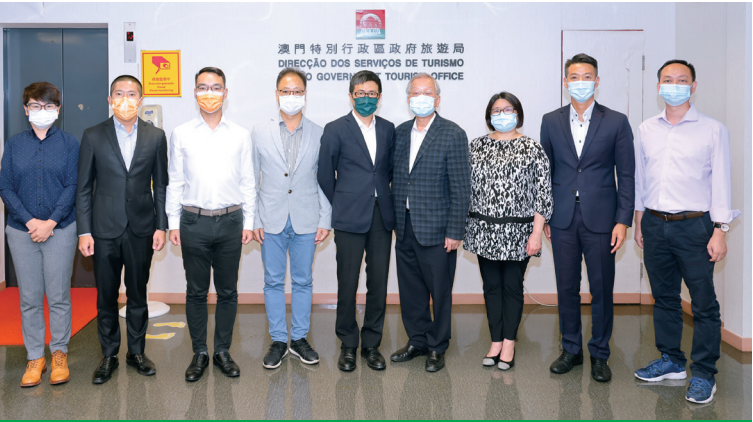
匯澳優質生活展拜訪旅遊局

非常適合旅遊局藉此平台向外推廣新興遊澳熱點、多元特色資源及產品等，將會研究有關項目的合作空間，希望能透過此活動達至相互推動的效果，預計計劃成功開展，同時表示今年會繼續支持及推動是次項目。 匯澳優質生活展籌委會感謝旅遊局的接待，期望旅遊局參與和支持相關的展覽會，加強推廣澳門自家品牌發展，共同推動本地大中小企邁向大灣區，深化粵港澳合作，充分發揮三地綜合優勢，促成區內的深度融合，推動區域經濟協同發展。