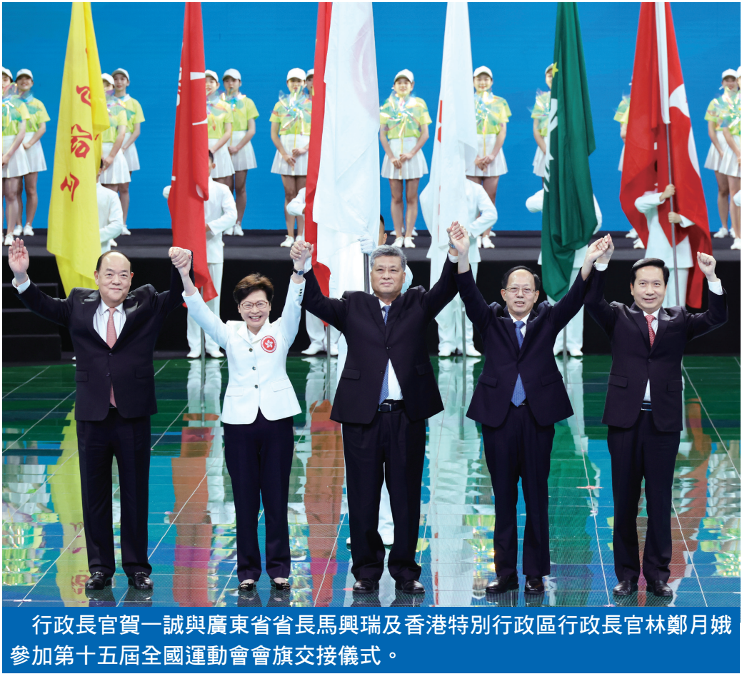
行政長官賀一誠與廣東省省長馬興瑞及香港特別行政區行政長官林鄭月娥參加第十五屆全國運動會會旗交接儀式。