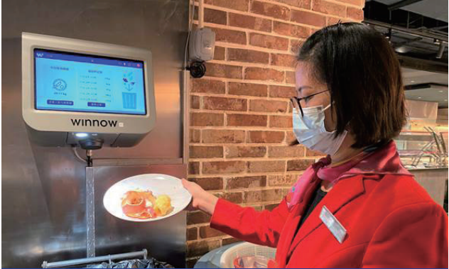
新濠旗下位於澳門及馬尼拉的綜合度假村的所有同事用餐區均已安裝 Winnow Sense 系統，以測量餐盤浪費。