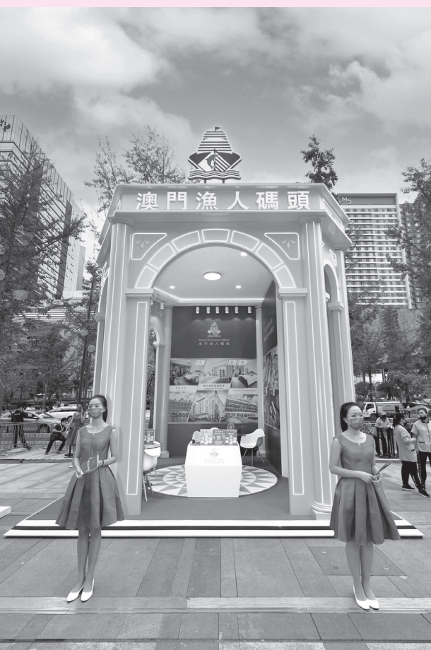
漁人碼頭參與“四川成都澳門周”

【本報訊】由澳門特別行政區政府多個部門參與舉辦的大型“澳門周”活動，已在北京、杭州、南京、上海等地舉辦多場路展，向內地旅客推介澳門旅遊，宣傳澳門健康安全宜遊的旅遊環境。澳門漁人碼頭繼續支持活動，參加最新於成都交子廣場舉辦的“成都澳門周”路展活動，並提供一系列酒店住宿及餐飲等優惠，以吸引內地旅客來澳旅遊。是次“成都澳門周”已於(9月24日)傍晚隆重開幕，澳門特別行政區政府行政長官賀一誠等主禮嘉賓均有出席開幕活動，活動於9月23日至27日早上11時至晚上10時開放，以味遊澳門、澳門概況、澳門盛事等作主題，展開探索“澳”秘之旅，場內更設置多款藝術裝置、表演區及品鑑區等，內容更加豐富，大大增加旅遊推廣的體驗和整體氣氛。