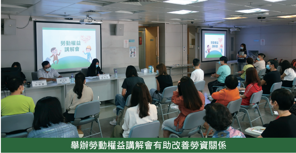
舉辦勞動權益講解會有助改善勞資關係

情穩定後，不失時機推進澳門的經濟適度多元發展，加快粵澳合作項目，保持了澳門良好發展局面，中央充分肯定行政長官和特區政府的工作。 李克強總理指出，中央政府堅定不移貫徹“一國兩制”方針，全力支持行政長官帶領特區政府依法施政，並希望特區政府繼續抓好疫情防控，做好穩定經濟、改善民生的工作，堅定不移推進經濟適度多元發展，用好聯通海內外的獨特優勢，在融入國家發展戰略中發揮更有效作用。 行政長官表示，2020年是澳門極為艱難和極不平凡的一年，新冠肺炎為澳門經濟帶來沉重打，在中央政府的關心和支持下，特區政府採取了一系列抗疫措施，保持了澳門經濟社會和諧穩定。他續指，新的一年，特區政府將繼續做好疫情防控工作，積極對接國家發展戰略，加快推動經濟復甦，努力開創澳門發展新局面。