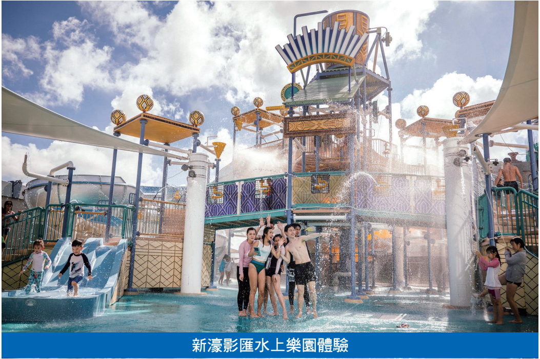
新濠影匯水上樂園體驗

有關參與是次本地遊及本地酒店體驗計劃，以及各大旅行社的詳細資料，請查閱專頁： https://www.macaotourism.gov.mo/zh-hant/article/subsidies/macao-tour-hotel 。如有其他查詢，請於早上9時至下午7時致電83963052/28389153。