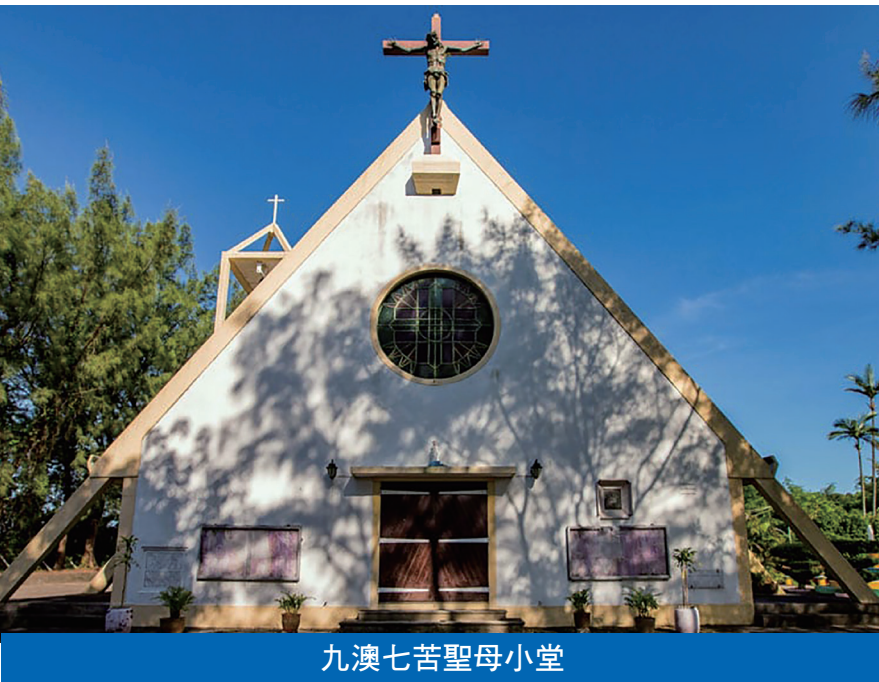
九澳七苦聖母小堂