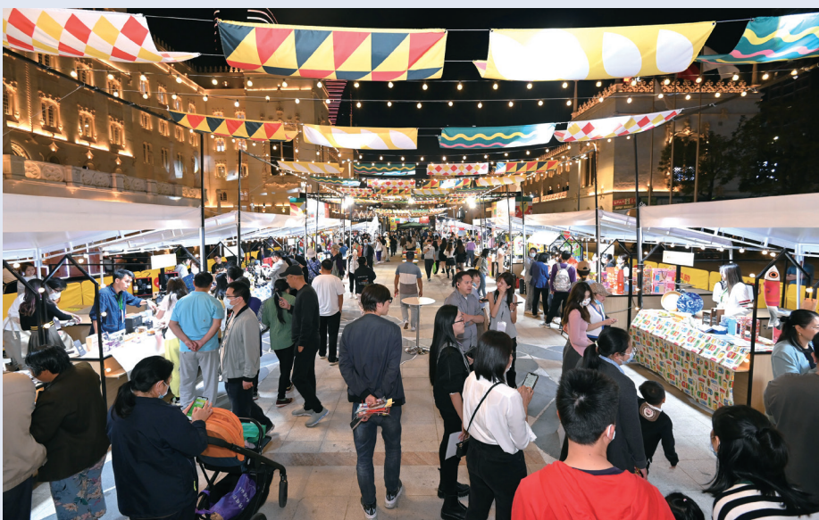
往屆“齊齊葡”（橫琴站）特色市集熱鬧聚人氣

活動期間每天將舉辦10場工作坊，包括“葡萄畫”、精油香薰DIY、馬賽克杯墊、手工樂器工作坊、環保袋熨畫等葡式工藝品製作。此外，現場還免費開放“齊齊拋圈圈”、“齊齊大彈弓”等互動小遊戲。同時