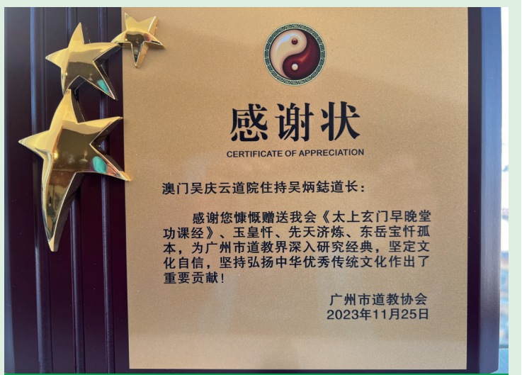
廣州市道教協會感謝狀