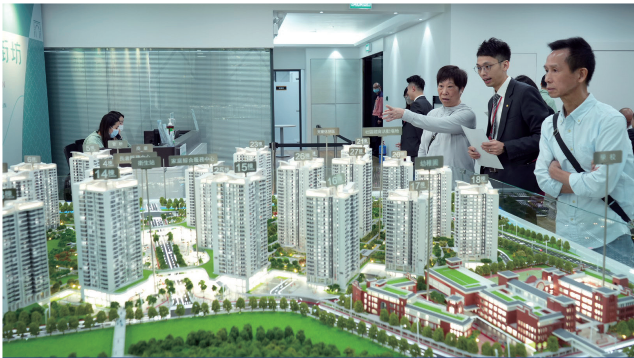
澳門銷售中心位於南灣大馬路599號羅德禮商業大廈1樓

如欲了解詳情，可登入澳門新街坊專題網頁（ https://mur.com.mo/mnnproperty ）或電郵至mnn_property@mur.com.mo或致電（853）2888 2235了解橫琴「澳門新街坊」認購申請事宜。