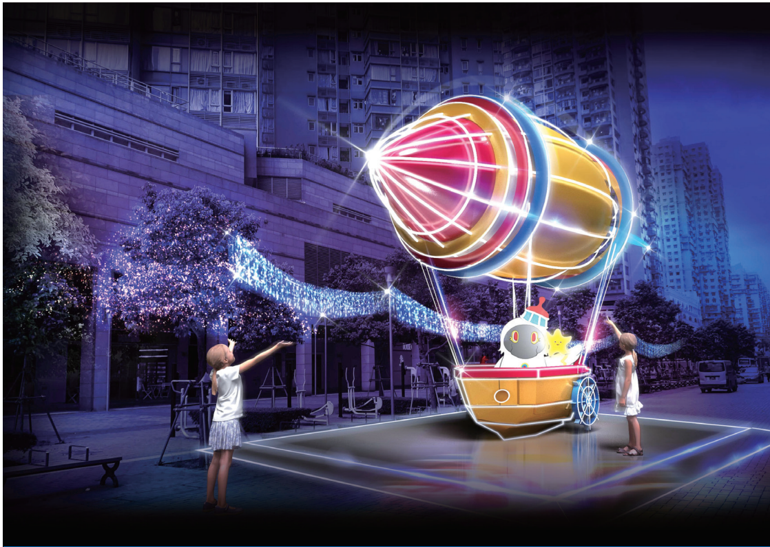
幻彩耀濠江活動將打造多項浪漫繽紛的燈光裝置

【本報訊】為增添節日喜慶氣氛，市政署將於十二月十六日起在塔石廣場一連十七天舉辦聖誕市集，以“聖誕夢工房”為主題，除有二十三個售賣聖誕禮品及食品的特色攤位，現場亦設有充滿聖誕氣氛的旋轉木馬嘉年華、聖誕轉轉杯設施等，與市民及遊客共度普天同慶的聖誕節。 市集將設有十五個聖誕禮品檔及八個小食檔，當中部份聖誕禮品檔會邀請社團、文化發展基金聯繫本澳文創企業，以及市民共同參與經營，讓售賣產品更多元化及支持本土文化創意產業。 為增添市集的歡樂氣氛，現場將安排流動表演(如聖誕老人扭汽球、小丑雜耍或魔術表演)及AR擴增實境拍照、馬槽及聖誕小木屋佈置。還有更深受小朋友歡迎的玩樂項目，包括旋轉木馬嘉年華及轉轉杯，以及迷宮遊戲；設施開放時間為每日下午3時至晚上10時，免費提供予市民遊玩。為減省市民輪候時間，旋轉木馬嘉年華及轉轉杯設施將提供派籌及網上預約取籌，另現場亦提供有少量名額。聖誕市集豐富多彩的攤位及活動，適合一家大小參與，共同歡度愉快的節日時光。 本年度聖誕市集將於十二月十六日至明年元旦日舉辦，其中十二月二十四日、二十五日及三十一日開放時間為下午二時至晚上十二時，其他日期為下午二時至晚上十一時。活動期間，於亞豐素雅布基街設有臨時公眾上落客貨區，方便市民到場。市政署歡迎市民及遊客一同參與聖誕市集，詳細節目內容及遊樂設施預約取籌安排可瀏覽市政署網頁 www.iam.gov.mo 及現場宣傳指示。