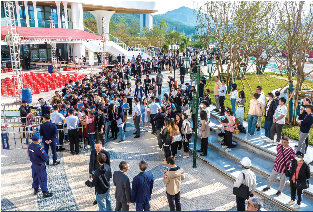
現場排隊人潮熙來攘往，市場反應相當踴躍。