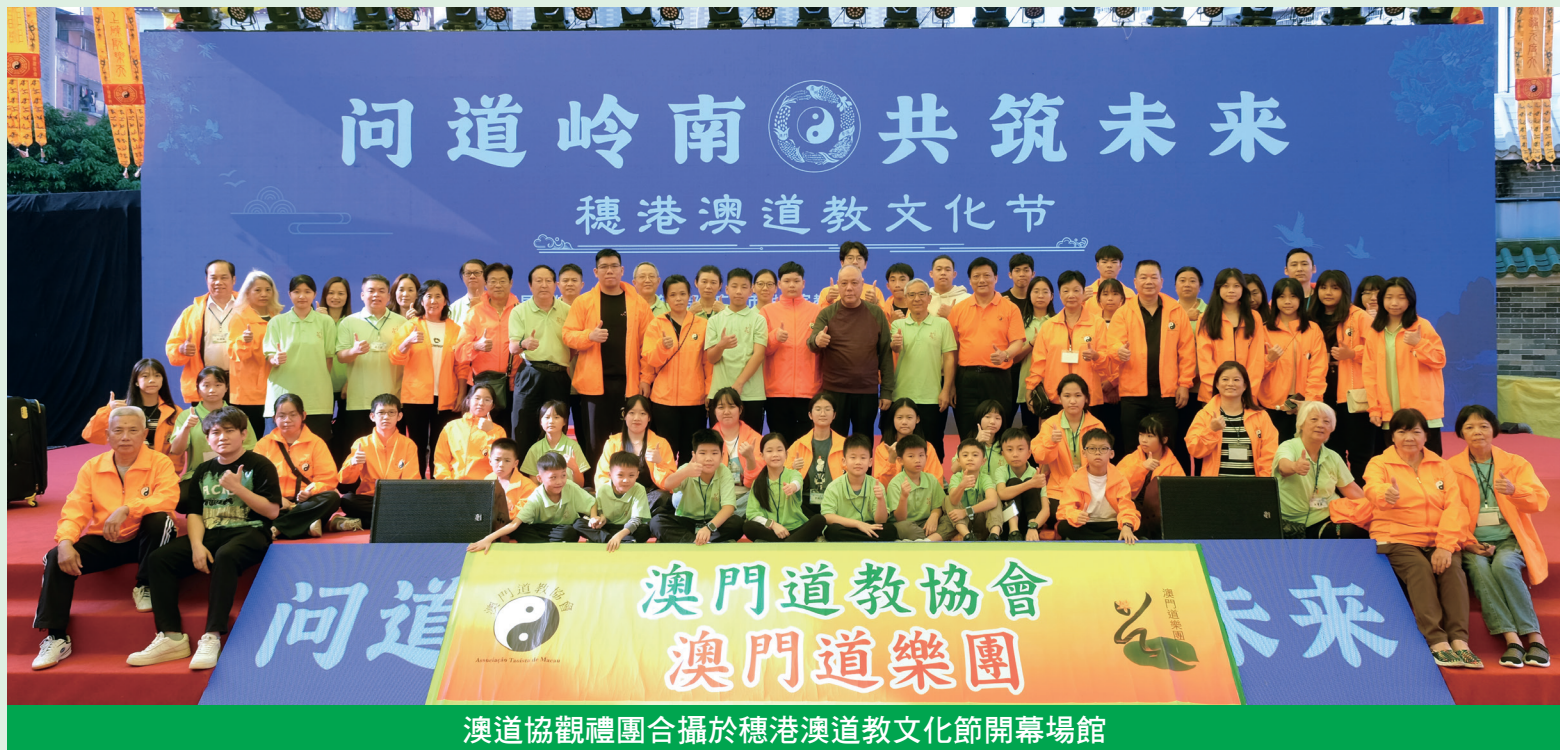
澳道協觀禮團合攝於穗港澳道教文化節開幕場館