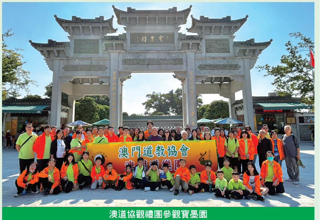
澳道協觀禮團參觀寶墨園