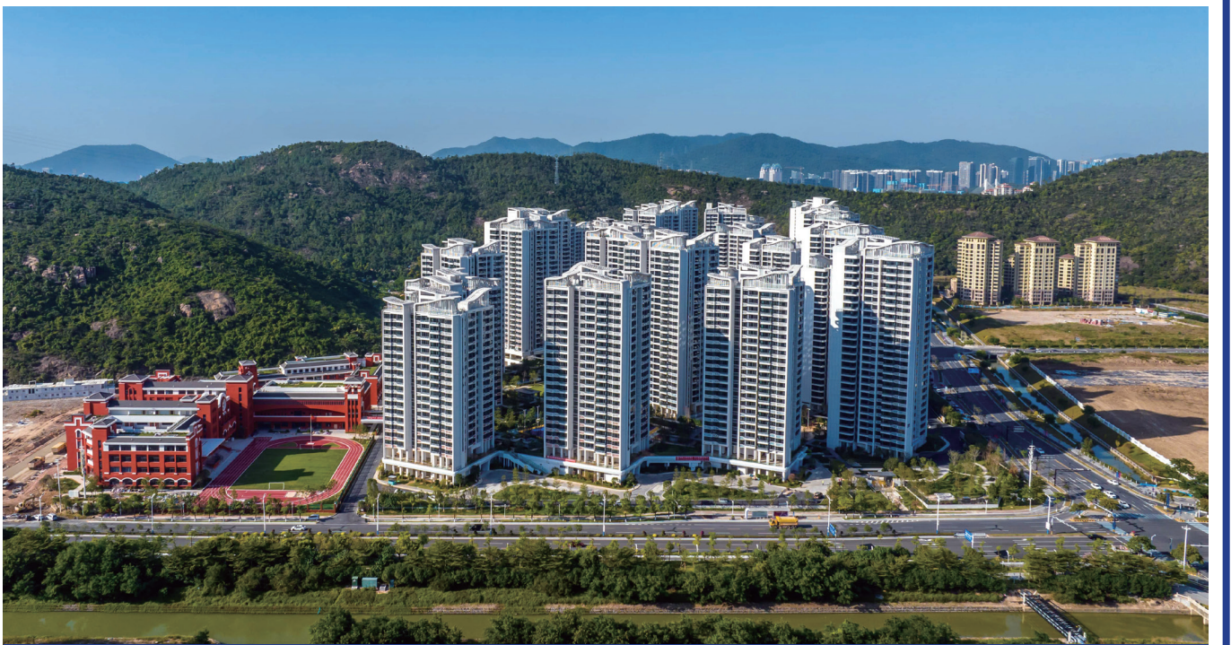
澳門新街坊現正公開接受認購