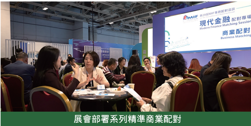
展會部署系列精準商業配對

有本地潮流品牌企業與現代金融機構達成合作協議，作為澳門首間與現代金融機構合作的零售品牌，該企業代表稱受惠於本澳四大新興產業發展，助力澳門中小企業、尤其青年企業獲得更多資源，創設更大的營商舞台。