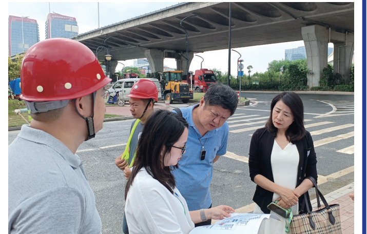
澳紐集團一行考察橫琴科學城

放時間為周一至周日上午9時至下午6時（內法定節假日除外）。項目設免費穿梭巴士接載市民往返橫琴「澳門新街坊」及橫琴口岸，每日首班穿梭巴士發車時間為上午9時，尾班車發車時間為下午5時15分，從橫琴口岸珠方口岸北迎客平台北2門候車停泊區出發，約15分鐘一班次，歡迎市民乘搭前往參觀。