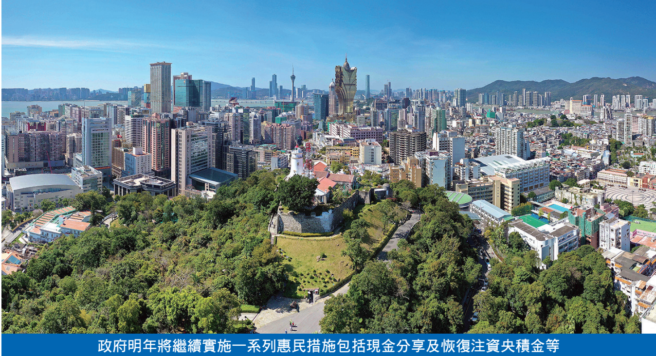
政府明年將繼續實施一系列惠民措施包括現金分享及恢復注資央積金等