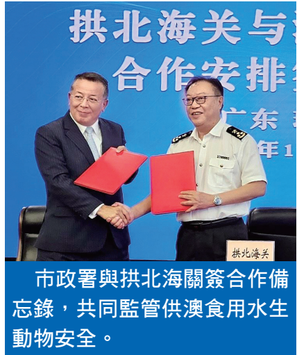
市政署與拱北海關簽合作備忘錄，共同監管供澳食用水生動物安全。

市政署感謝國家海關總署及拱北海關一直以來對澳門食品安全和進口檢疫工作的支持與幫助，於今年八月份已與拱北海關簽署了《關於供澳門冰鮮水產品檢驗檢疫監管的合作安排》，今次的合作備忘錄進一步加強供澳水產品的檢驗檢疫合作，未來將繼續創新，優化跨區