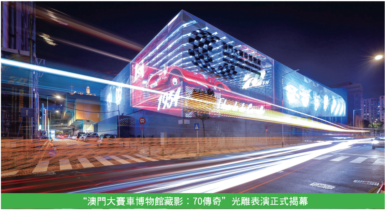
“澳門大賽車博物館藏影：70傳奇”光雕表演正式揭幕

【本報訊】旅遊局配合即將舉行的第70屆澳門格蘭披治大賽車，打造“澳門大賽車博物館藏影：70傳奇”光雕表演。這個以賽車為主題的全新表演在11月1日至30日每晚7時至10時，共上演12場，5分鐘的光雕表演以“銘記時刻”及“競技與專業”兩個篇章帶大家從博物館出發，讓居民和旅客透過光影體驗感受“旅遊+體育”的魅力，融入賽車月的氛圍中。