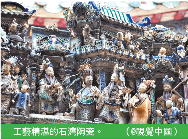
工藝精湛的石灣陶瓷。

廣州佛山形成“前店後廠”格局 細究緣由，佛山當時冶鐵業的空前繁榮與其毗鄰廣州、擁有“近水樓臺先得月”的優勢不無關係。 如果僅從地理的角度解讀廣佛兩地，兩者最重要的特質是地處中國大陸南端，遠離政治中心而瀕臨大海，這種天然的稟賦造就了廣佛兩地重商輕農的氣質；如果再比較兩地的經貿氣質，那麼兩者又是同中有異，是“前店後廠”的關係——廣州更側重商貿，佛山則更注重工農業。 據歷史學博士、廣州大學教授黃濱介紹，在商品經濟高速發展的條件下，廣州原有的打鐵業已無法滿足城市發展對鐵制產品迅速增加的需求。面對如此數額巨大且非常穩定的市場需求，佛山一些村民為增加收益“孤村鑄煉”，而後漸成規模，聲名遠播，也引起政府重視。經過廣東官府大力扶植，佛山成為滿足省會廣州政府機構治煉需求提供專屬服務的專門場所。明朝政府規定，廣東所有生產鐵礦的地方一律不得在各處冶鐵，全部鐵礦石運送到佛山進行統一冶煉。在這樣的“官准專利”下，大量佛山堡居民轉化為專業的冶鐵手工業者或業主。據佛山碑刻史料記載：明代“本堡食力貧民”已“皆業爐冶”。至明中葉，佛山發展成為“兩廣鐵貨所都，七省需焉”的手工業巨市，佛山鐵器在全國打開了廣闊銷路。至清朝康熙年間，佛山冶鐵業產值估計超過一百萬兩白銀。