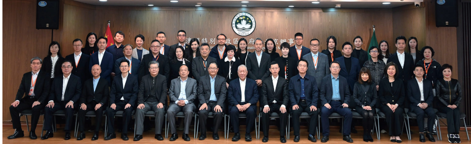
澳門文化界人士國情研習班開班儀式全體合照

【本報訊】由澳門中聯辦宣傳文化部和澳門文化界聯合總會在中央文化和旅遊管理幹部學院共同舉辦的“澳門文化界人士國情研習班”於上月31日在北京舉辦，將於明日結業。旨在進一步提高澳門文化界對習近平文化思想的認識，加強對國情的認識和瞭解。澳門文化界各專業領域代表、青年骨幹共23人參加。 開班儀式在澳門特區駐北京辦事處舉行，全國政協副主席何厚鏞，澳門文化界聯合總會會長吳志良，澳門中聯辦宣傳文化部副部長、一級巡視員殷汝濤，中國文聯港澳臺辦公室主任董占順，中央文化和旅遊管理幹部學院黨委書記喻劍南等參加。 吳志良表示，首次在北京舉行澳門文化界人士國情研習班，相信可以增強學員對習近平文化思想的認識，增加對中華文化傳統