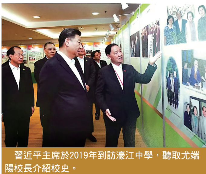
習近平主席於2019年到訪濠江中學，聽取尤端陽校長介紹校史。