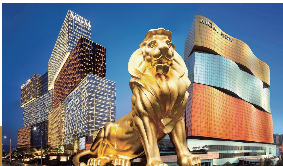
美高梅中國納入恒生可持續發展企業基準指數

美高梅中國於可持續發展營運和報告操守上的堅定承諾備受肯定。公司於「2021年亞洲可持續發展報告大獎」中勇奪「亞洲最佳可持續發展報告（首次發佈）」之銅獎。這項年度大獎被譽為全球最重要的可持續發展獎項之一，美高梅更成為當年第一及唯一一家澳門機構獲頒發該獎項。