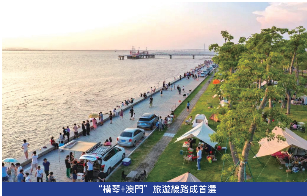
“橫琴+澳門”旅遊線路成首選

同時，雙節期間橫琴客運碼頭正式迎來第70萬個遊客，即2023年7月中旬碼頭刷新成立以來40萬年度客流紀錄後，暑期持續保持客流高位，月均超過10萬人次。