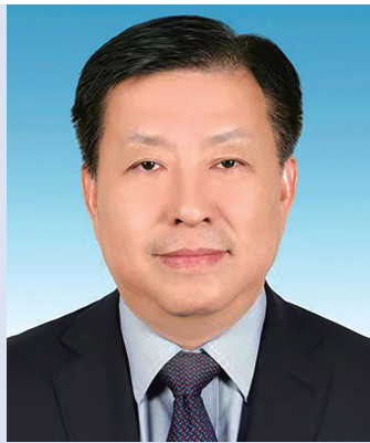
敦請 江蘇省方偉副省長蒞臨主禮

日期：2023年10月15日 時間：下午3點 地址：澳門大學崇文樓（E34） 主辦單位：江蘇省海外聯誼會 蘇州海外聯誼會 澳門大學