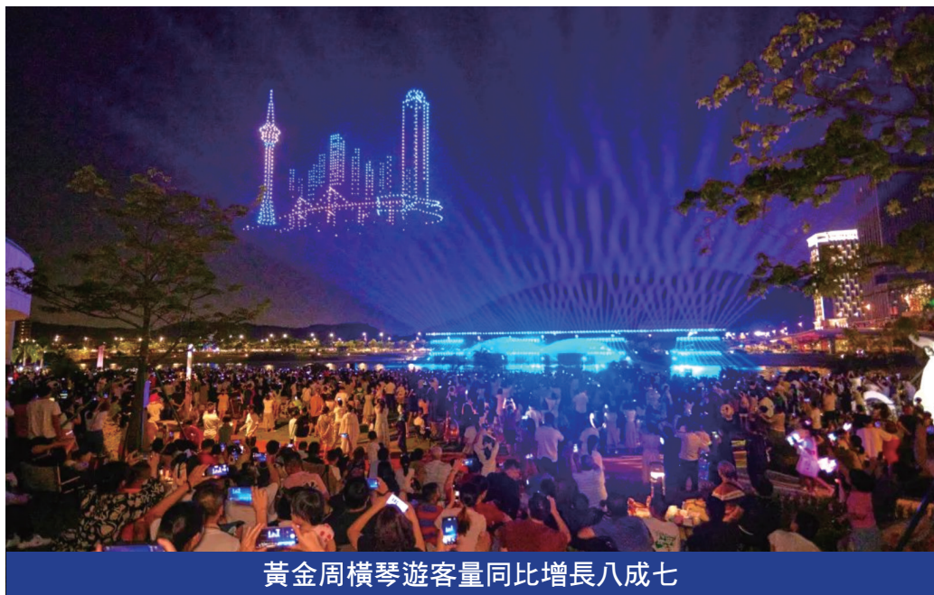
黃金周橫琴遊客量同比增長八成七

景觀、景點人潮如織。隨處可見的澳門單牌車，意味著不少澳門居民在這裡悠閒度假。據珠海大橫琴琴建發展有限公司統計，橫琴花海長廊、芒洲濕地公園、二井灣濕地公園、天沐河賽艇公園和小橫琴山步道等城市公園、濱海景觀帶以及城市驛