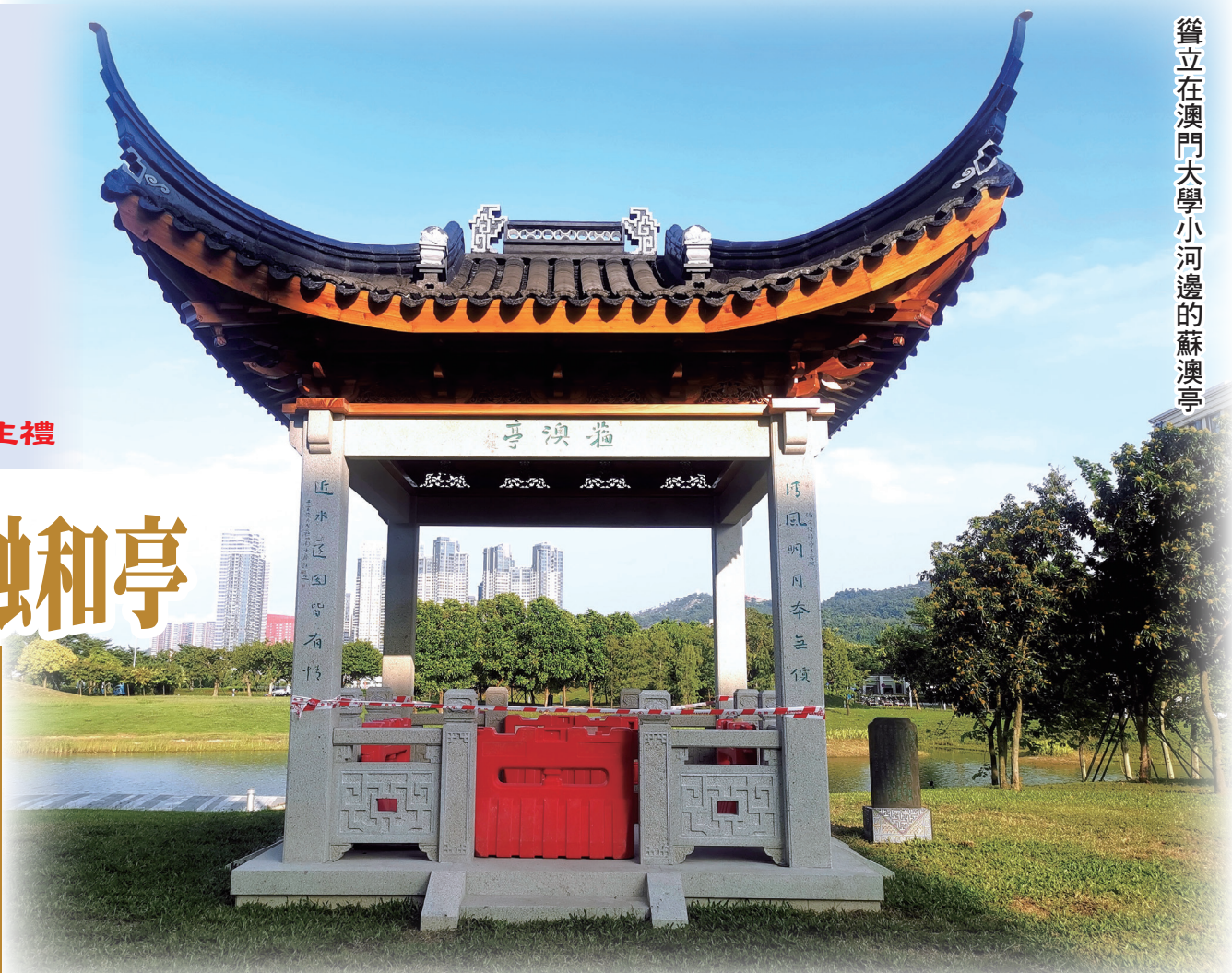
聳立在澳門大學小河邊的蘇澳亭