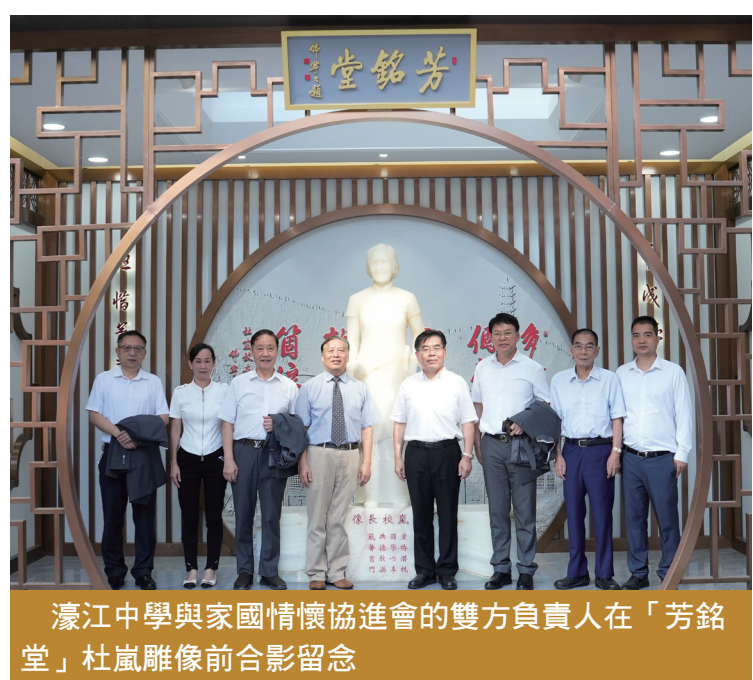
濠江中學與家國情懷協進會的雙方負責人在「芳銘堂」杜嵐雕像前合影留念

家國情懷協進會理監事主要成員參觀“芳銘堂”後，一致認為在學校開展愛國愛澳教育很有必要，把一腔家國情的宣講帶進校園有利於在青少年中厚植家國情懷，這次活動選在濠江中學展開，是選對了，選準了，既可重溫歷史，又能啟迪後人。人們完全相信，在新的歷史時期，濠江中學定能再接再厲砥礪前行，續寫輝煌的篇章！