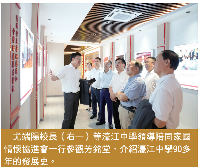
尤端陽校長（右一）等濠江中學領導陪同家國情懷協進會一行參觀芳銘堂，介紹濠江中學90多年的發展史。