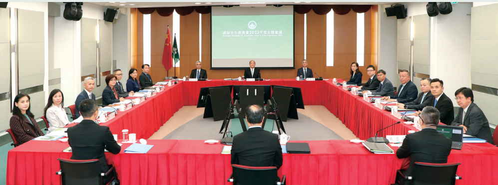
行政長官賀一誠主持網絡安全委員會2023年度全體會議

【本報訊】網絡安全委員會日前在政府總部召開本年度全體會議，會上審議了《2022年度網絡安全總體報告》、討論澳門維護網絡安全工作的最新情況，並規劃部署後續的網絡安全重點工作計劃。 網絡安全委員會主席、行政長官賀一誠強調維護網絡安全能力是新時代發展的重要保障，要求各部門以維護國家安全的視野看待網絡安全建設發展，準確把握發展與安全的內在關係，實現以新安全格局保障新發展格局。 會上，委員會副主席、保安司司長黃少澤從深化工作成果、增拓技術配套、營造良好生態三面總結了特區政府過去一年的網安工作情況。網絡安全事故預警及應急中心運作統籌方的執行代表匯報《2022年度網絡安全總體報