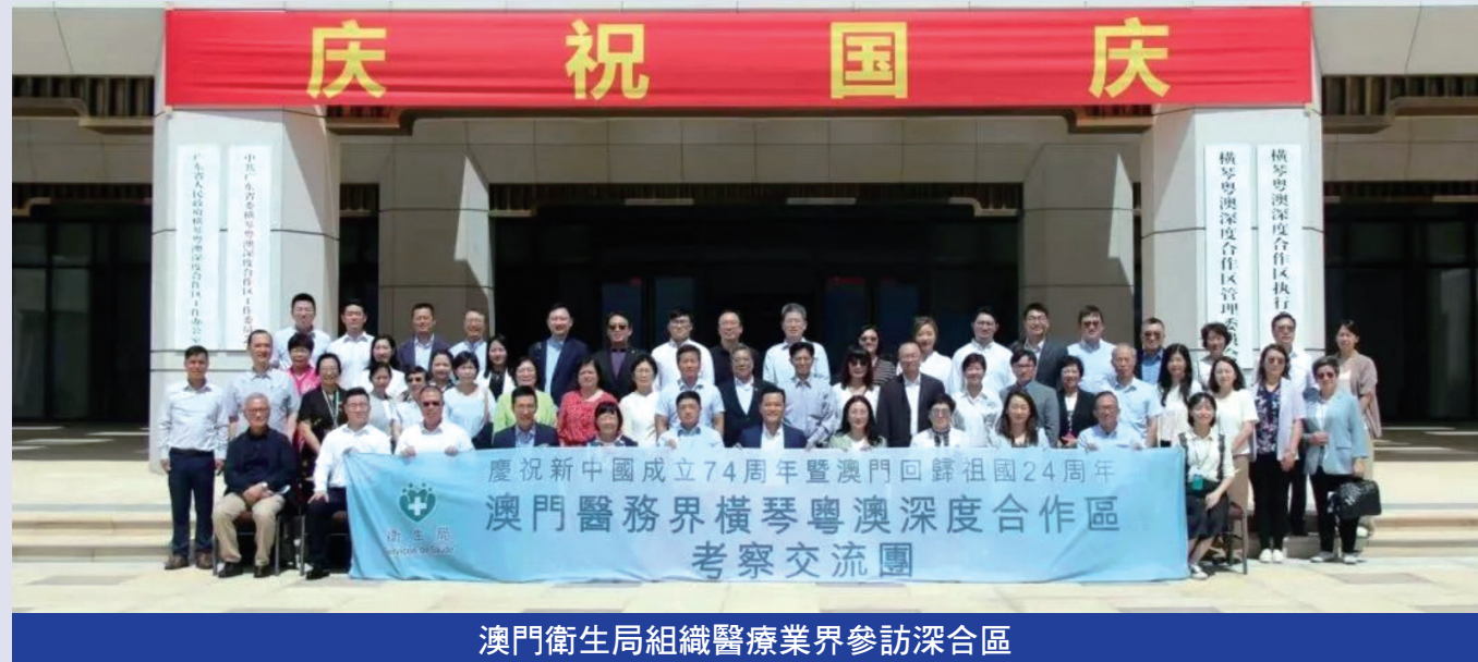
澳門衛生局組織醫療業界參訪深合區

澳門特別行政區政府衛生局局長羅奕龍日前帶領澳門醫務委員會成員、私營醫療機構、醫療團體及非營利性醫療機構代表一行40餘人到橫琴粵澳深度合作區開展考察交流，探討進一步促進琴澳兩地的衛生事務合作及發展的新模式，實地瞭解深合區的執業需求及醫療服務發展情況。深合區民生事務局局長黃宇傑、副局長馮方丹接待參訪團，並開展交流座談。