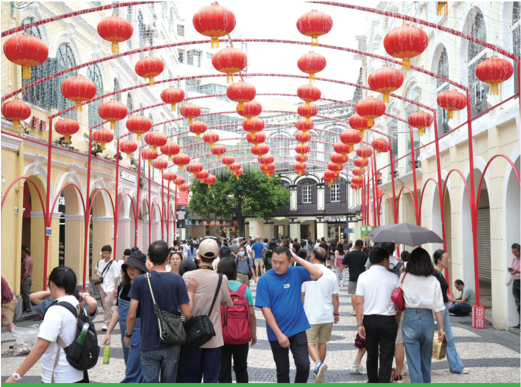
新馬路一帶入境旅客絡繹不絕

人次。 今年國慶假期的日均旅客有116,546人次，與去年（2022年）國慶假期相比上升366.4%；與今年勞動節相比上升18.7%；今個國慶假期日均旅客與2019年同比，客量恢復接近8成4，顯示澳門旅遊業復甦勢態良好。 據業界提供的資料顯示，中秋國慶假期澳門酒店業場所的平均入住率為87.9%，較去年國慶假期上升23.7個百分點。當中10月1日的入住率最高，達94.3%，創今年新高。 澳門酒店業場所（酒店、公寓式酒店及經濟型住宿場所）在中秋國慶假期的平均房價約為1,804.1澳門元，較去年國慶假期上升61.7%，較今年勞動節相比上升0.9%。 中秋國慶“雙節”長假期間，城中有多項盛事活動，豐富旅客體驗。澳門、氹仔及路環旅遊景點及街區人流暢旺，氣氛熱鬧，帶動旅遊經濟活力。旅遊局主辦的第31屆澳門國際煙花比賽匯演於10月1日國慶當晚呈獻煙花表演，與居民及旅客共賀國慶。旅遊局並支持長假期間舉辦不同主題的社區活動，促進社區旅遊及消費。此外，福隆新街步行區於9月29日起試行，發揮文旅效應，讓旅客體驗多元創新“旅遊+”。 旅遊局加強線上線下推廣並因應節假日，透過網紅的號召力及於社交媒體平台加推社區旅遊、國慶煙花及“雙節”特別活動宣傳，同時推廣“感受澳門 樂無限”月月精彩活動。此外，持續透過線上旅遊平台向旅客發放酒店優惠券，配合中秋和國慶假期加推疊加優惠及聯名禮盒，着力吸引旅客來澳旅遊，延長留澳時間，刺激