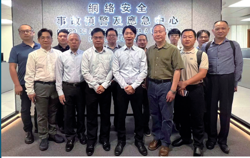
郵電局組織業界參觀本澳網安中心

【本報訊】為響應2023國家網絡安全宣傳周，郵電局組織業界人士參觀本澳網絡安全事故預警及應急中心；冀透過活動讓各持份者了解本澳網絡安全的最新狀況及日常運作，提升網絡安全意識。 郵電局為配合2023年國家網絡安全宣傳周以“網絡安全為人民，網絡安全靠人民”的主題，於9月16日組織本澳“視聽廣播”及“電信範圍”等關鍵基礎設施營運者之代表，參觀本澳網絡安全事故預警及應急中心。讓各業界人士了解中心的日常運作，加深認識網絡安全對國家及社會的重要性，同時提升網絡安全的防護能力，維護網絡安全，共同努力構建社會網絡安全防線。