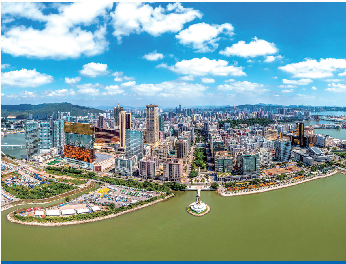
世界旅遊經濟論壇為澳門務實推進一紮實“1+4”多元發展策略

胡和平表示，中國政府高度重視旅遊業發展，隨著旅遊業強勢復甦，有效帶動城鄉就業和關聯產業的發展，為擴內需、穩增長、惠民生提供有力的支撐。他並建議各地深入推動大眾旅遊、加快培育智慧旅遊、探索發展綠色旅遊和堅持開放合作。