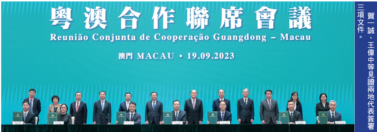
賀一誠、王偉中等見證兩地代表簽署三項文件。

出席會議的還有行政法務司司長張永春、經濟財政司司長李偉儀、社會文化司司長歐陽瑜、行政長官辦公室主任許麗芳；廣東省副省長張新，以及粵澳兩地政府相關部門領導。