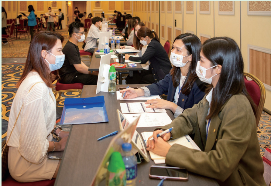
2022年青年就業博覽會情況 (資料圖片)

是次博覽會設有18場專題講座，有涉及與橫琴深合區產業佈局和青年發展機遇相關的講座，亦有與四大產業相關的講座，包括人工智能、新能源、高新科技、中醫藥、企業數字化、現代金融、航空、基建及高端零售等多個領域，邀請不同領域的業界精英到場主講和就業輔導服務，包括模擬面試工作坊、履歷撰寫工作坊、生涯規劃、社會保障諮詢、職業技能展示等，讓青年提升求職競爭力，為投身職場做好準備。