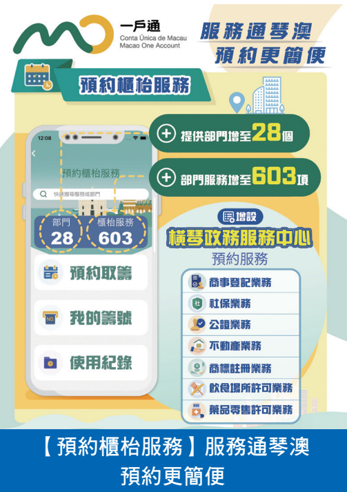
【預約櫃檯服務】服務通琴澳 預約更簡便

琴澳兩地政府部門鼎力合作，充分發揮規則銜接優勢，在政策和技術層面均具有重要意義，亦為下一階段工作累積了經驗。未來，特區政府將陸