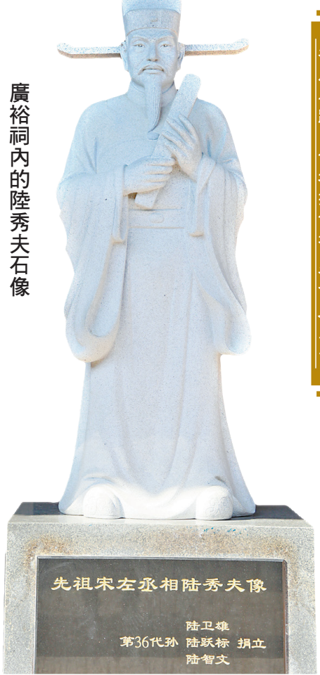
廣裕祠內的陸秀夫石像