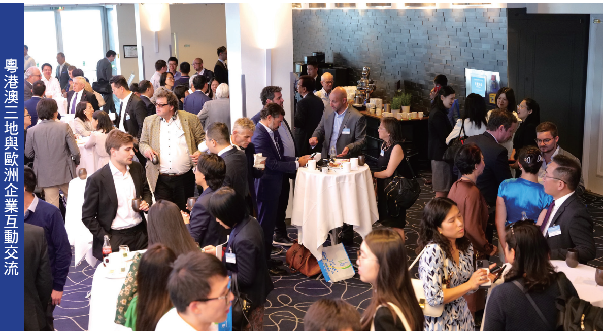
粵港澳三地與歐洲企業互動交流

交流會期間亦舉行了“主題論壇：創新驅動灣區未來”，大灣區城市分組進行政策推介，同時現場設有行業對接洽談環節，粵港澳三地企業與歐洲企業互動交流，助力企業更好把握大灣區營商機遇。此外，於慕尼黑期間，廣東省商務廳、香港投資推廣署及澳門貿易投資促進局亦按協作機制，共同商討大灣區推介工作安排。