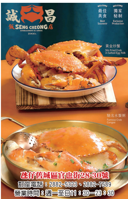
誠昌 SENG CHEONG 店

最新之全球首發藝術作品—「Mr Doodle（塗鴉先生）| 米奇雕塑」，高度為30cm，引用米奇最經典的造型之一，雙手背於身後、翹起腳尖，面帶微笑、傲然挺立。全球限量500版之「Mr Doodle（塗鴉先生）| 米奇雕塑」全身塗滿Mr Doodle（塗鴉先生）代表性的塗鴉紋飾，雕塑主體選用了樹脂為媒材，紋飾採用凹凸浮雕工藝，顏色以注射工藝填充，為深受喜愛的迪士尼角色米老鼠增添了俏皮和藝術氣息。