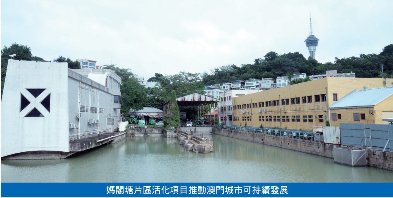
媽閣塘片區活化項目推動澳門城市可持續發展

休閒活動及文創園區，提升居民文化生品質，亦為居民和旅客提供豐富的文化資源。媽閣塘片區為本澳現存較完整的海事歷史文化與工業廠房片區，主要由昔日政府船塢的造船部、機械部、木工部，以及海事部門辦公室和市立屠房等建築所組成，見證了十九世紀末以來該區發展與變遷。該區至今仍保存不少具工業特色建築物，以媽閣塘為中心形成聚落式工業建築群，其與周邊自然資源形成特色的歷史文化與景觀氛圍。