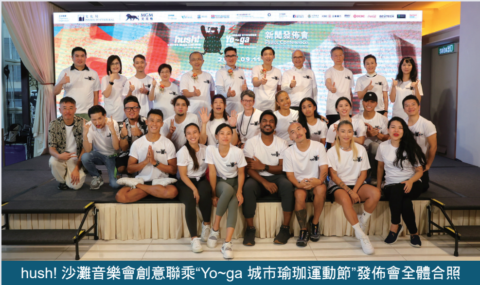
hush! 沙灘音樂會創意聯乘“Yo~ga 城市瑜珈運動節”發佈會全體合照