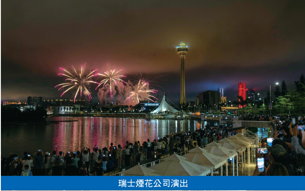
瑞士煙花公司演出

濱休憩區、澳門科學館海堤、南灣、雅文湖畔、沙格斯大馬路（澳門文華東方酒店側）及氹仔海洋大馬路。 “火樹銀花嘉年華”於每個煙花演出日下午5時至晚上11時在觀光塔街（旅遊塔旁空地）舉辦，而分別設於南灣、雅文湖畔和氹仔海濱休憩區的“花火大會”市集活動亦將於每個煙花演出日的晚上6時至11時舉行，居民和旅客可於以上三個地點一邊看煙花一邊品嚐美食、玩遊戲、看表演。 今屆澳門國際煙花比賽匯演將有攝影比賽和學生繪畫比賽，讓一眾攝影愛好者和學生分享創意之作，遞交作品日期截至2023年10月31日止。