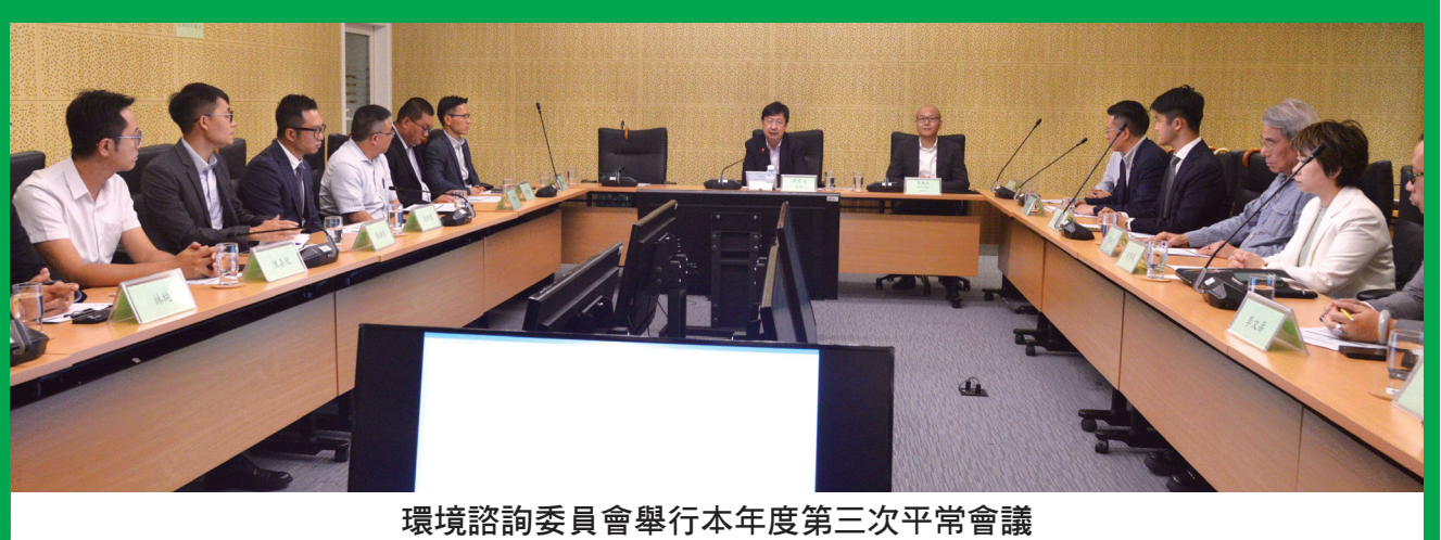
環境諮詢委員會舉行本年度第三次平常會議