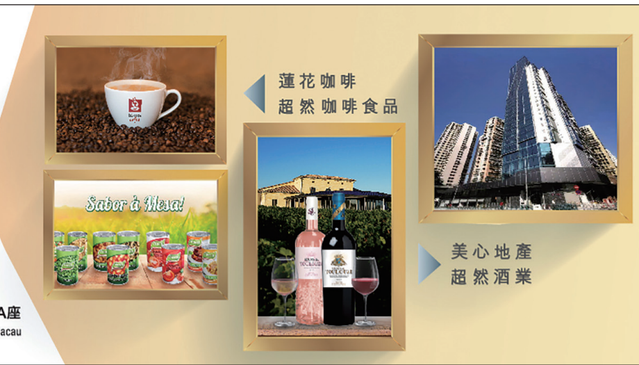
誠昌 SENG CHEONG 店