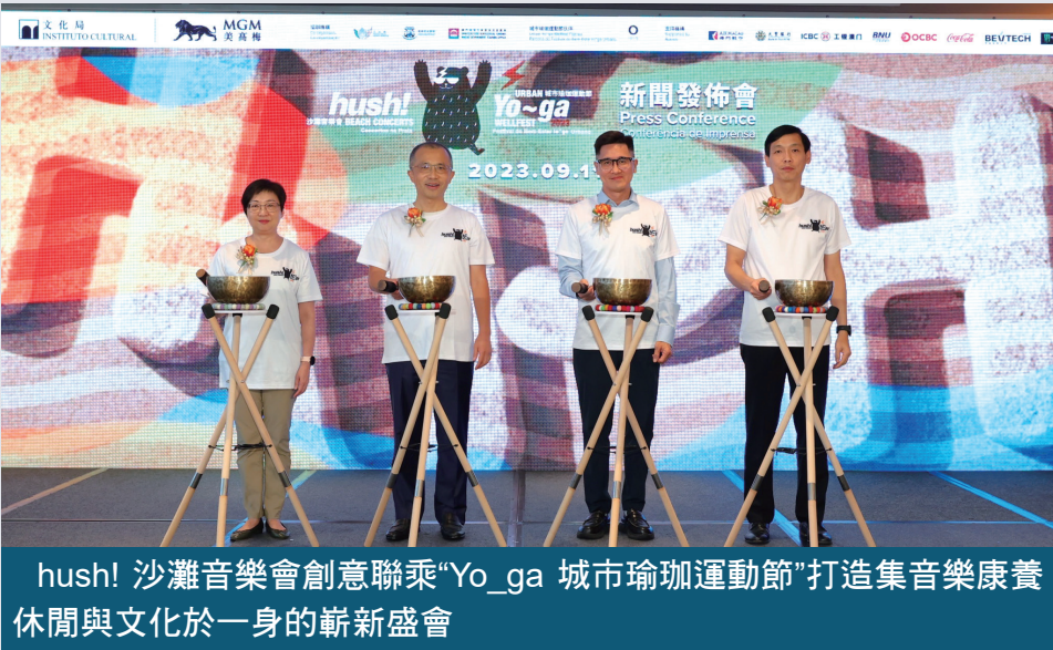
hush! 沙灘音樂會創意聯乘“Yo~ga 城市瑜珈運動節”打造集音樂康養休閒與文化於一身的嶄新盛會