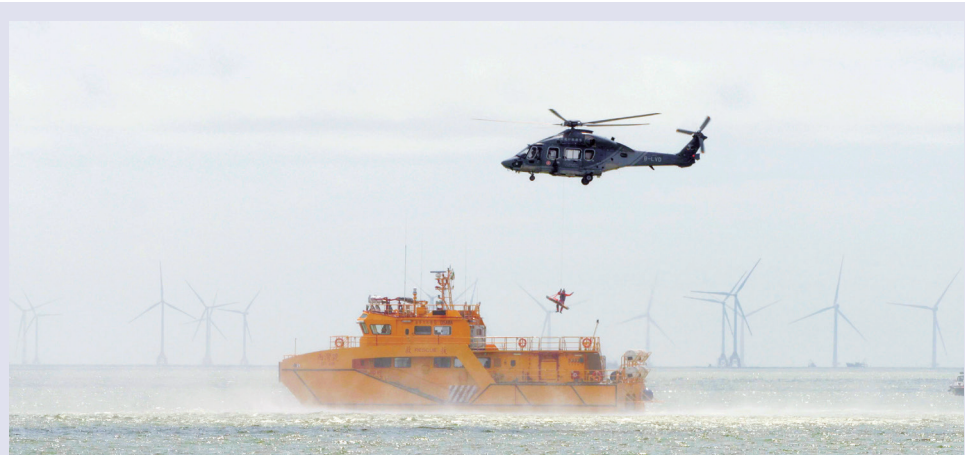
模擬直升機由海事局救援船上吊運傷者

為提高應對珠江口水域突發事件的海上搜救能力，粵港澳三地海上搜救單位於日前在外港航道入口以北海域舉行“2023年粵港澳三地海上搜救聯合演習”，對海上事故聯合搜救進行實際演練，透過區域合作機制，動員各救援單位協同搜救，提高海上搜救能力。