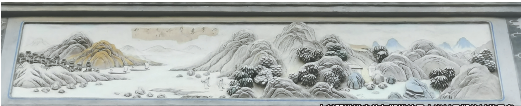
大魁閣塔塔身的灰塑描繪了大嶺村早期的村落景象