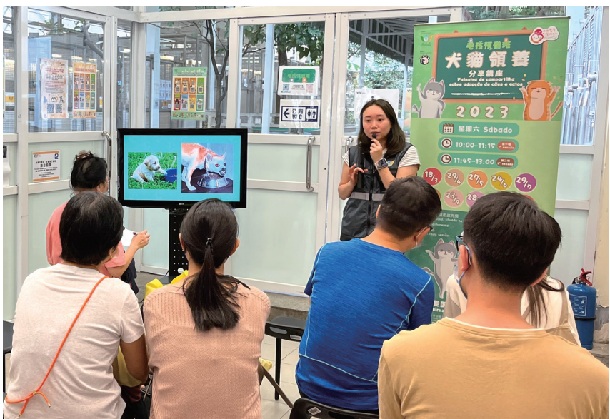
犬貓領養分享講座，助新手飼主與領養動物建立互信。

【本報訊】九月份市政署與動保團體繼續合辦多場動保教育活動，包括“毛孩預備班—寵物資訊站”及“犬貓領養分享講座”，以多元方式宣傳養寵知識及飼主責任等，歡迎市民踴躍參加。 毛孩預備班—寵物資訊站將於九月十六日在塔石廣場舉行，透過攤位遊戲及展覽等形式，普及養寵知識，推廣《動物保護法》、《動物防疫法》與飼主責任等。活動無須預約報名，歡迎市民、家長帶同小孩到場參與。 “犬貓領養分享講座”將於九月二十三日在澳門提督馬路市政狗房舉辦共兩場次，時間分別為上午十時至十一時十五分及上午十一時四十五分至下午一時。活動設市政狗房參觀環節，讓參與者與待領養犬貓互動。有興趣的