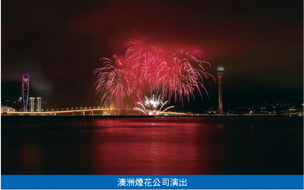
澳洲煙花公司演出