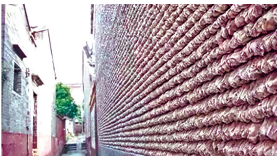
大嶺村的蠔殼牆

龍津街1號是一棟青磚平房，門簷處刻滿牆畫。當地村民介紹，這些古民居中，刻有牆畫的不少，沿路遍佈的42個古門坊，不少也有留下來的牆畫，古色古香。裏巷深深，不僅是村民日常的出行通道，這裏也記錄了村民日常生活的悠然自得，鄰里之間的互幫互助，街頭巷尾的淳樸民風。