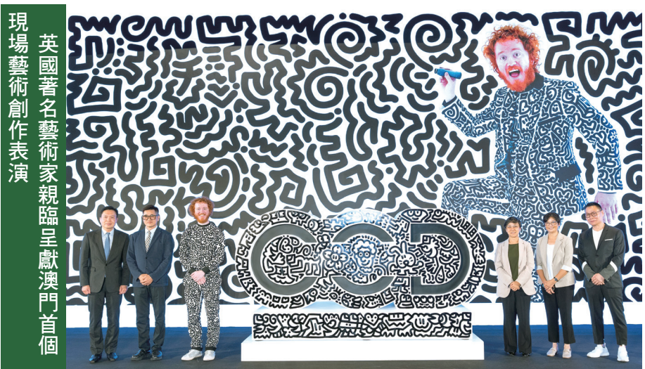
誠昌 SENG CHEONG 店