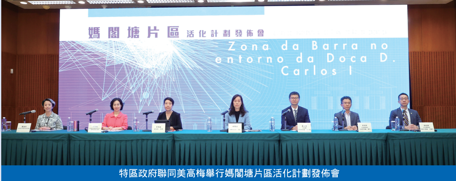
特區政府聯同美高梅舉行媽閣塘片區活化計劃發佈會

焦點新聞 政府聯同美高梅中國控股有限公司推進“媽閣塘片區活化計劃”，該計劃以建築保育、社區發展、文化推動為原則，深入挖掘媽閣塘社區歷史故事，打造具本地文化特色且可持續發展的全新城市公共界面。活化計劃範圍面積約3.5萬平方米，涉及13幢建築物，將注入文創銷售、藝術展覽、輕食茶座、特色餐飲、藝術展演及裝置等，並將串聯大三巴核心區、世遺核心路徑及周邊旅遊資源，帶動人流走入舊區。