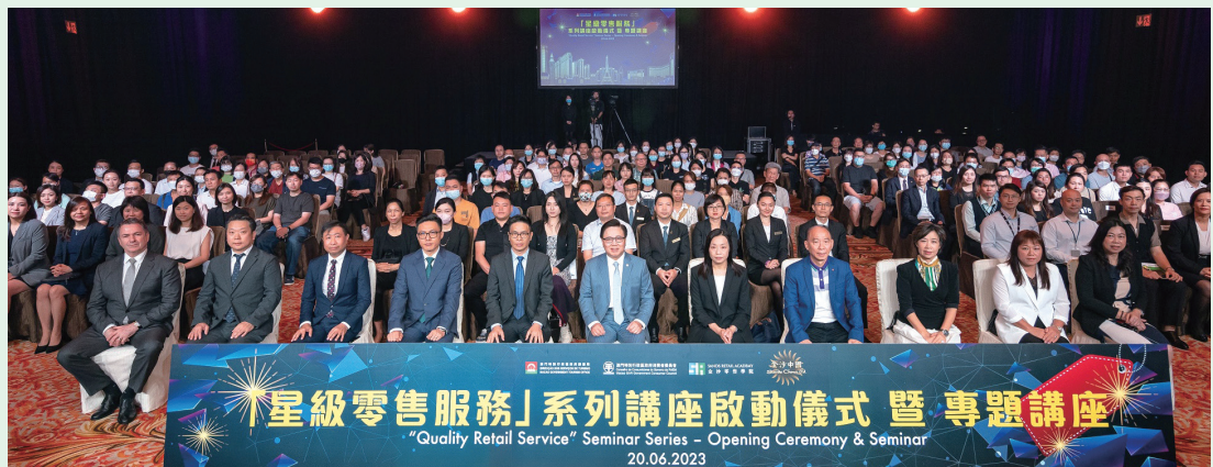
金沙零售學院獲本年度亞太旅遊協會人力資本發展項目金獎

金沙零售學院是金沙中國學院旗下八所專科學院之一。金沙中國學院是金沙中國為員工及本澳業界專才而設的全面培育發展平台。學院除了致力為員工開展多元化的培訓項目外，更與本澳及國際各大專院校合作，積極推動本澳各業界專才發展。