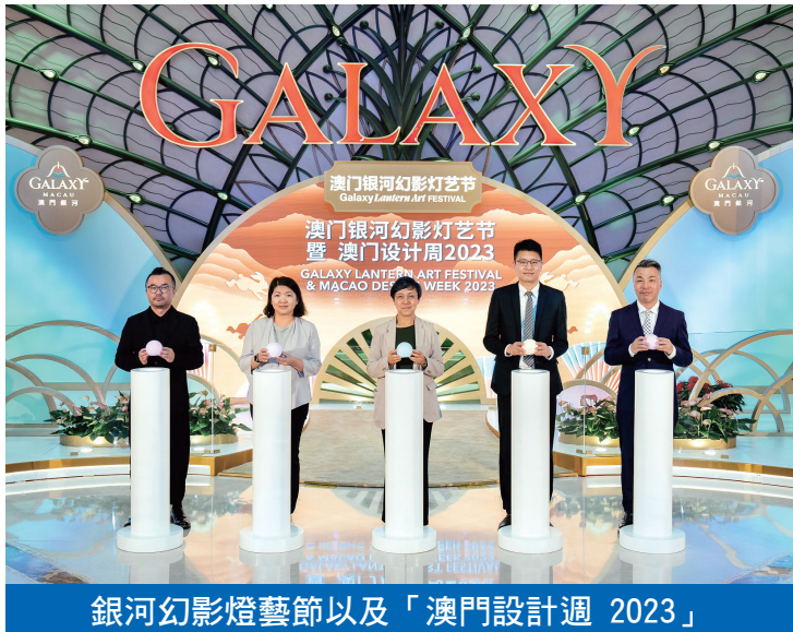
銀河幻影燈藝節以及「澳門設計週 2023」

日，澳門銀河與澳門設計師協會攜手於東翼廣場合辦“澳門設計週二〇二三”，以“城市的關鍵詞”為題，匯聚來自澳門、新加坡和日本的五十多個設計組織，展示八十件藝術作品；設計周期間亦將舉辦各種主題展覽、設計之旅、工作坊等活動，激發藝術文化的互動交流。