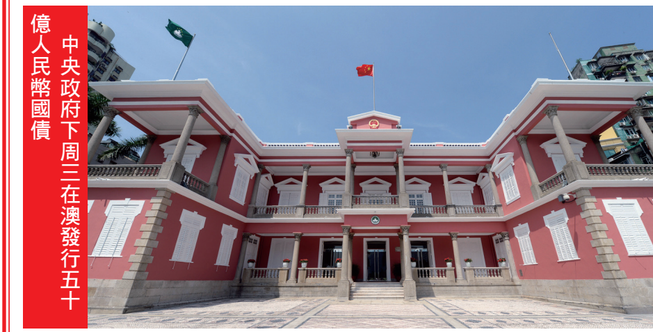
億人民幣國債 中央政府下周三在澳發行五十