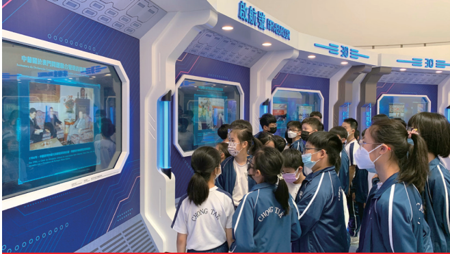
學生觀賞展覽內容