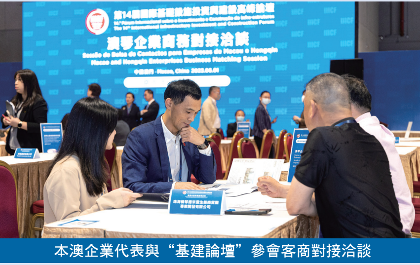
本澳企業代表與“基建論壇”參會客商對接洽談

增超過1倍（去年19份），涉及東南亞、莫桑比克和幾內亞比紹等葡語國家地區，涵蓋交通運輸、房屋建設、電力工程、水利建設、新能源以及產學研融合發展、人才培養等領域和範疇，涉及金額約67億美元，體現基建論壇在搭建高端平台、促進務實合作的重要作用。