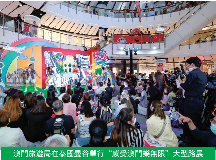
澳門旅遊局在泰國曼谷舉行“感受澳門樂無限”大型路展

【本報訊】澳門特區政府旅遊局6月2至4日一連三天在泰國曼谷舉行“感受澳門樂無限”大型路展活動，聯同澳門旅遊業界特設多個展位和互動遊戲，吸引大批當地居民及旅客到場體驗澳門“旅遊+”魅力。期望帶動泰國客源來澳旅遊，進一步拓展國際客源市場，促進旅遊經濟復甦。