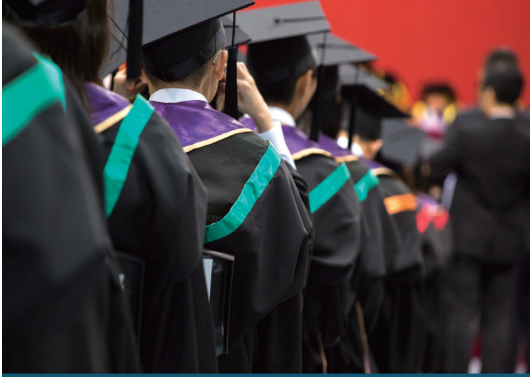
澳大將於6月10日舉行畢業典禮

【本報訊】澳門大學將於6月10日下午4時在澳大綜合體育館（N8）舉行2023年畢業典禮，向應屆學士畢業生頒發畢業證書。今年的畢業典禮繼續線上線下同步舉行，讓身處各地的畢業生和親友都能分享喜悅。