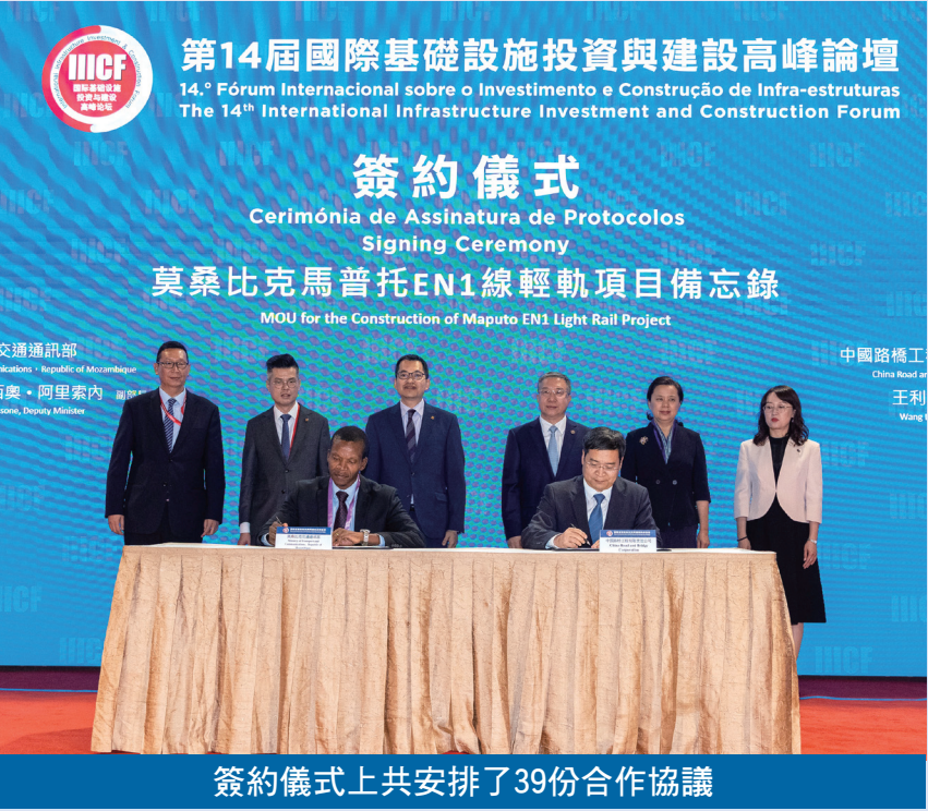
簽約儀式上共安排了39份合作協議