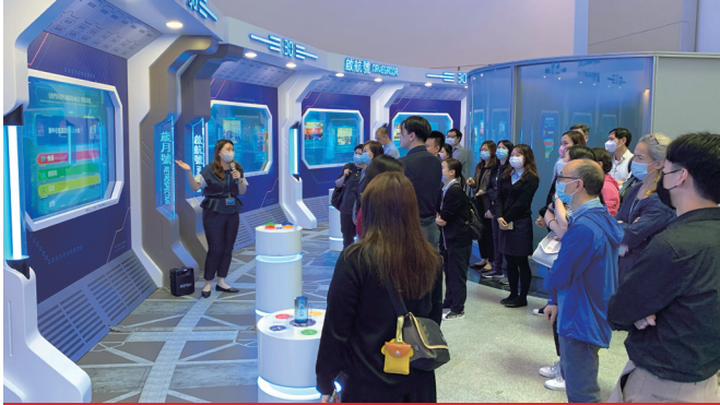
主辦單位組織團體到場觀展

為讓泰國業界進一步瞭解澳門旅遊優勢及嶄新“旅遊+”項目，旅遊局攜同澳門旅遊業界率先在路展開幕前舉辦泰國澳門旅遊業界推介會，向當地業界介紹澳門旅遊優勢及嶄新旅遊產品，吸引兩地約120人出席參加，反應踴躍。現場亦設洽談環節，兩地業界積極交流洽商，探討合作意向，拓展合作空間。