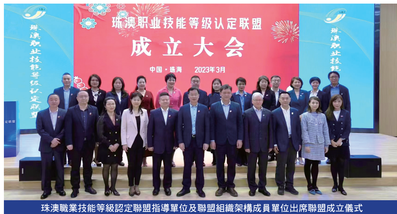
珠澳職業技能等級認定聯盟指導單位及聯盟組織架構成員單位出席聯盟成立儀式

透過兩地多方面的合作，“聯盟”將充分發揮優勢互補的作用，共同推動區域人才協同發展的同時，促進灣區產業創新及發展。