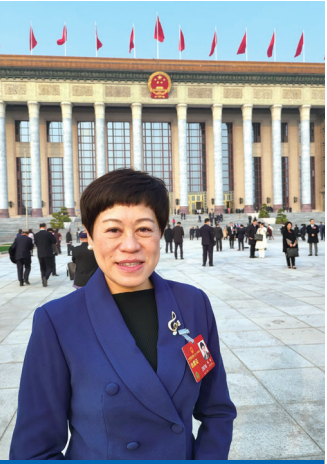
澳區全國人大代表陳虹

三、支持港澳青少年赴內地體驗中華傳統文化資源，提升港澳青少年民族自豪感和“人心回歸”。習主席指出，中華優秀傳統文化是中華文明的智慧結晶和精華所在，是中華民族的根和魂，是我們在世界文化激蕩中站穩腳跟的根基。香港和澳門社會擁有以中華文化為主體的多元文化特徵，推動港澳青少年學生瞭解和學習中華優秀傳統文化，對構建和確立他們對中華文化的文化自覺和文化自信大有裨益。國家文化、教育、旅遊等部門需挖掘中華優秀傳統文化中的育人資源，推薦更多中華優秀傳統文化傳承人、文化藝術大師、文博專家等到香港和澳門組成恒常宣講團，並進行表演、演講、展覽等，講好中國故事，涵養青少年文化品質。同時，加強支持港澳青少年學生赴內地參加文化實踐、歷史考察、藝術採風等活動，使參與者瞭解中華民族博大精深優秀文化，在潛移默化的薰陶中，增強國家認同感和文化自豪感。