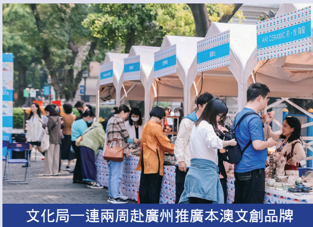
文化局一連兩周赴廣州推廣本澳文創品牌