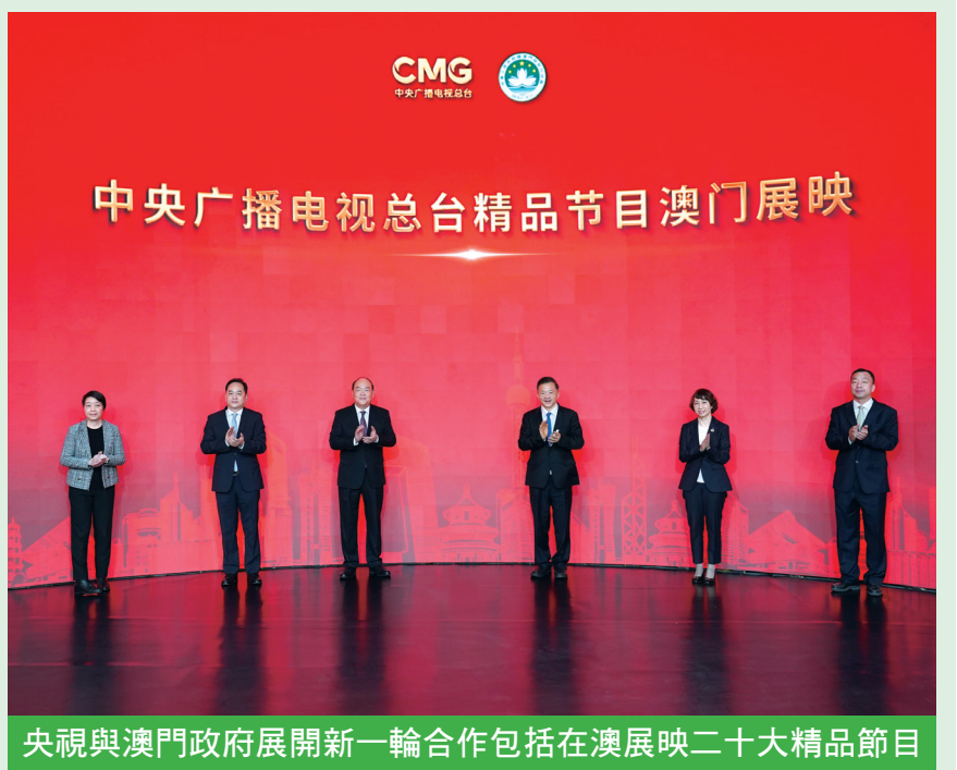
央視與澳門政府展開新一輪合作包括在澳展映二十大精品節目

此外，由澳門政府與中央廣播電視總台聯合攝製推出的紀錄片《世界遺產漫步》（澳門篇）和《中國微名片·世界遺產》（澳門歷史城區篇）同步開機。節目將邀請受眾跟隨鏡頭“漫步”澳門歷史文化街區，沉浸式體驗澳門東西交融、獨一無二的城市魅力。