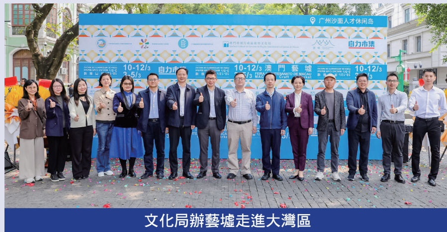
文化局辦藝墟走進大灣區

作人赴廣州參與展銷，期望透過組織本澳手作人到大灣區城市參與市集活動，將富有本澳特色的文創產品推廣至大灣區市場，增強本澳文創品牌的知名度，促進大灣區文創發展與交流。