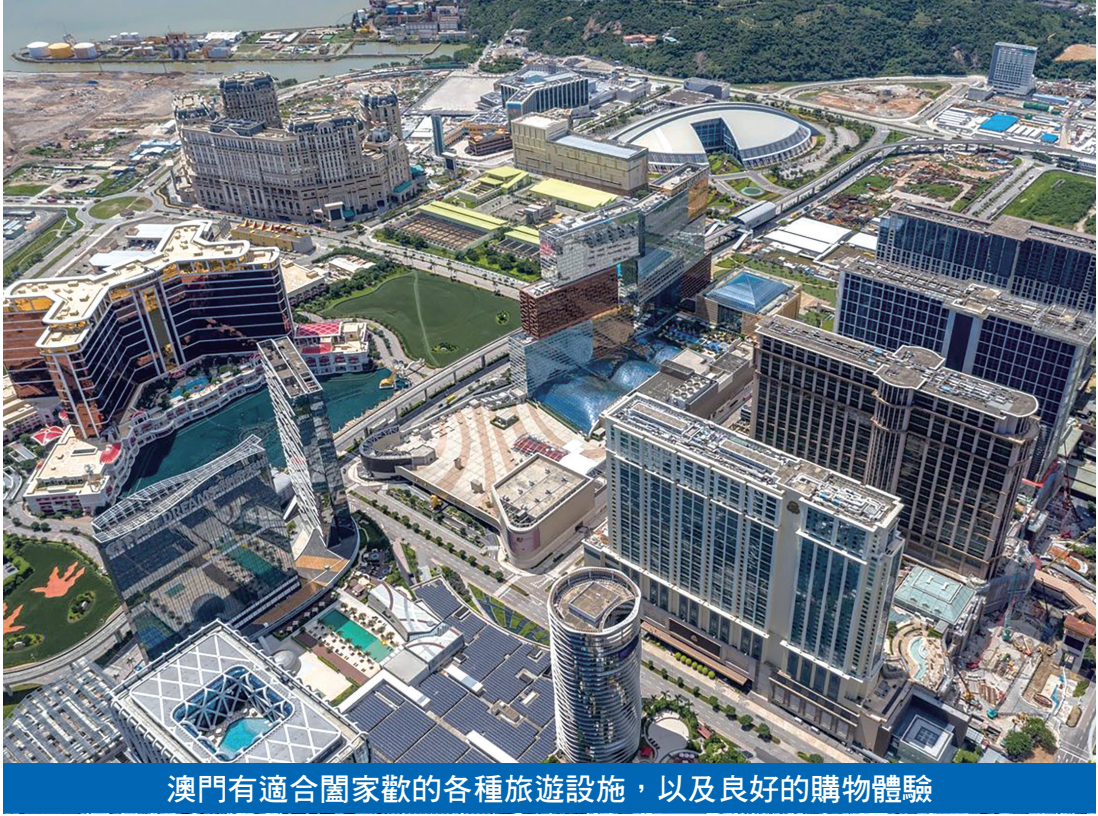
澳門有適合闔家歡的各種旅遊設施，以及良好的購物體驗

賀一誠接受央視大灣區之聲專訪時，記者談到有關澳門如何融入國家發展大局，促進澳門經濟適度多元發展的問題，賀一誠表示，光靠旅遊博彩業對澳門來講是問題，必須要多元發展，這是澳門社會的一個共識。當前，澳門特區政府正積極採取“1+4”適度多元發展策略，優化產業結構。“1”是按照建設世界旅遊休閒中心的目標要求，做優做精做強綜合旅遊休閒業；“4”是持續推動大