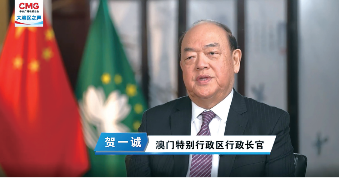
賀一誠 澳門特別行政區行政長官

澳遊客出現井噴式增長，有關澳門旅遊業疫情後的發展，賀一誠稱，即使在疫情期間，澳門這座旅遊城市的建設也不曾停止。澳門現有四萬多間豪華酒店房間，有適合闔家歡的各種旅遊設施，以及良好的購物體驗。