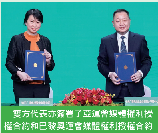
雙方代表亦簽署了亞運會媒體權利授權合約和巴黎奧運會媒體權利授權合約

兩制”成功實踐新篇章。 國務院港澳事務辦公室副主任楊萬明表示，央視高度重視對港澳傳播報導和交流合作，伴隨著一系列“滿屏皆精品”的創新成果，在港澳社會的引領力、傳播力、影響力不斷增強，得到各方面的高度讚譽。這次合作，將進一步推動廣大澳門同胞，特別是青少年增進對國家的認識認同，激發他們更好融入國家發展大局，為實現中華民族偉大復興發揮更大作用。 儀式上，雙方代表簽署了《第19屆杭州亞運會媒體權利授權合約》和《第33屆巴黎奧運會媒體權利授權合約》。根據協定，央視將自身持有的杭州亞運會賽事節目、巴黎奧運會賽事節目電視版權免費提供澳廣視播出。