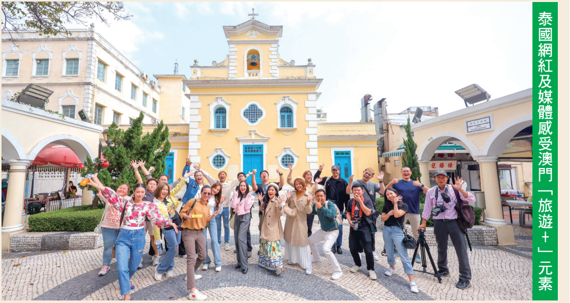
泰國網紅及媒體感受澳門「旅遊+」元素

同樣來自泰國的20多位旅遊業界代表將於3月13至16日來澳考察不同景點、酒店和旅遊設施及參加澳門旅遊推介會，同時與澳門多間酒店、旅行社、綜合旅遊休閒企業及旅遊相關設施等業界代表洽談業務，針對泰國旅客構思旅遊產品，共見商機。